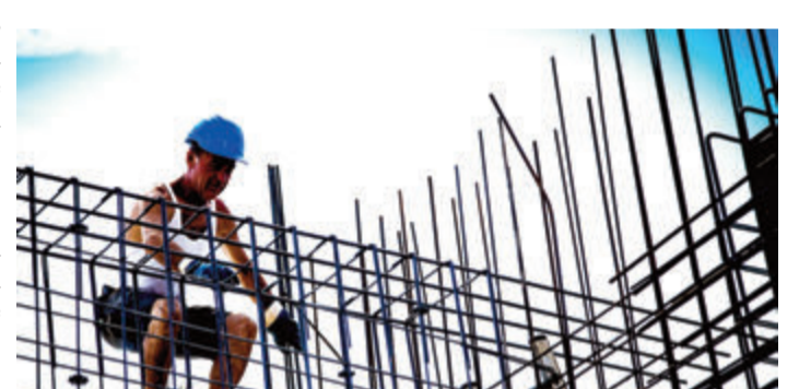
Ein Stahlflechter bei der Arbeit.