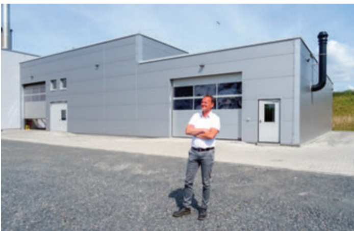
Ein Blick von außen auf die Produktionsanlage.