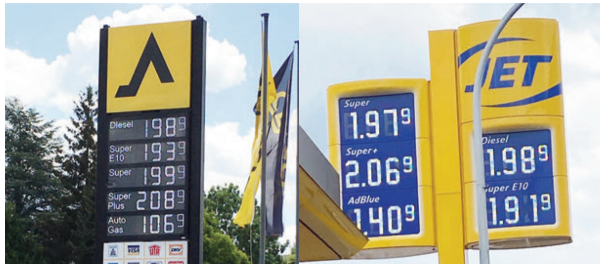
Es scheint nur noch der Himmel zu sein, der die Grenze für die Preise bildet; links die Classic Tankstelle in Michelstadt, rechts die Jet Tankstelle in Reinheim am 14. Juni.

Odenwaldkreis. Seit 1. Juni ist der langersehnte Tankrabatt endlich da und schon werden die Stimmen lauter, ihn möglichst bald wieder abzuschaffen. Obwohl es anfangs so aussah, dass die Spritpreise sinken, so kratzen diese mittlerweile wieder seit Tagen an der Zwei-Euro-Marke und der vermeintliche Rabatt kommt beim Endverbraucher nicht wirklich an. Der erhoffte Erfolg entpuppt sich also zunehmend zum Desaster.