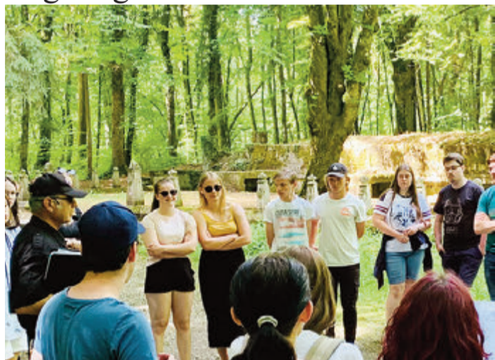
Die Abiturienten im Wald von Caures.

Die erste Station war der Wald von Caures, wo der Gästeführer den Beginn der Schlacht um Verdun im Februar 1916 veranschaulichte. Auf dem deutschen Soldatenfriedhof von Azannes wurde die Tour fortgesetzt. Hier liegen Soldaten begraben, die unter anderem aus Darmstadt und dem Odenwald stammten. Nach der Übernachtung in Verdun startete der zweite Tag mit dem Festungswerk Falouse, das demonstriert, wie der Soldatenall-