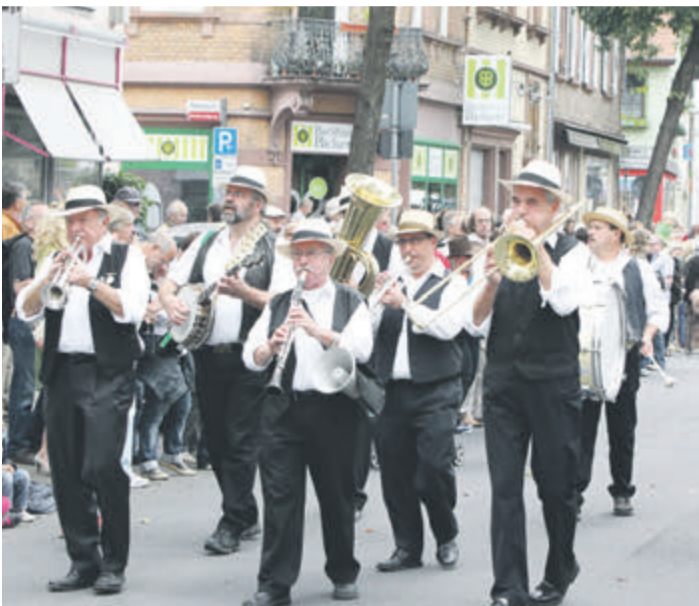
Schon oft und gern dabei: die „Zimmerner Kerb Dixie Stompers“.

auf dem historischen Marktplatz. Jeder mit Hut kann mitmachen – auch danach bei der Parade, bei der auch wieder attraktive Oldtimer, Liebhaberfahrzeuge und Tanzgruppen dabei sind. Ab 16 Uhr zieht die Parade vom Bahnhof aus durch Umstadts Mitte. Danach gibt es auf dem Marktplatz wie auch in Parks, Cafés und Biergärten Konzerte und gute Stimmung bis in die späten Abendstunden. Wenn sich das Wetter hält, wird dieses Großereignis wieder ein Besonderes – der Eintritt ist frei. Veranstalter ist das Kulturmanagement der Stadt Groß-Umstadt consult. red