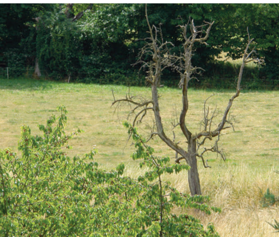
Toter Baum vor gelber Wiese in Lützelbach, und die Blätter im Vordergrund sind auch schon schlapp; wie hält sich der Odenwaldkreis im Dürresommer?