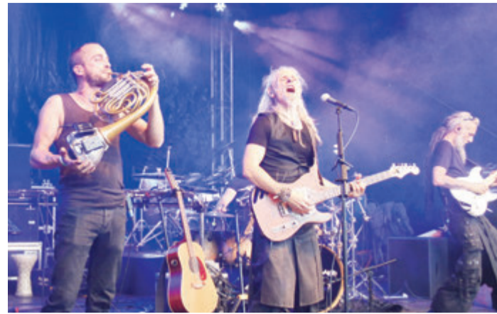
Lazuli, eine Progressive-Rock-Band, sind für das Finkenbachfestival auch gebucht.

Oberzent-Finkenbach. Zwei Tage Musik nonstop sind für den 12. und 13. August auf dem Finkenbach-Festival geplant, wenn neun Bands aus verschiedenen Genres auf dem Gelände neben dem FCF-Fußballplatz aufspielen. Gerade erst wurde das Line-up komplettiert, nachdem zwei eigentlich geplante Acts abgesagt hatten.