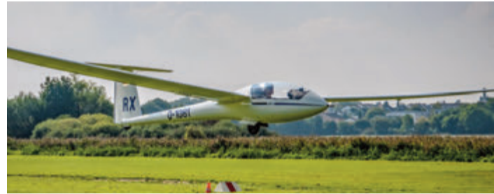
Im vereinseigenen Hochleistungsflugzeug LS8-18 starten die Reinheimer Piloten zum Liga-Flug.

Reinheim. Mit drei schnellen Flügen erreichten die Segelflieger der Flugsportvereinigung Reinheim (FSVOR) am vergangenen Wochenende Platz 8 in der 2. Segelflug-Bundesliga. Mit der erneut guten Rundenplatzierung liegen die Reinheimer nach 10 von 19 Wertungsrunden der Saison in der Tabelle mit Rang vier erstmal seit vielen Jahren auf einem Aufstiegsplatz zur 1. Segelflug-Bundesliga. Runde 10 hielt für die Segelflieger eher schwierige Bedingungen bereit, die notwendigen Aufwinde waren schwach ausgeprägt. Bei der Segelflug-Bundesliga kommt es auf Geschwindigkeit an: Die drei schnellsten Flüge eines Vereines über den Zeitraum von zweieinhalb Stunden gelangen pro Wochenende in die Wertung. Dokumentiert werden die Flüge über ein GPS-gestütztes Flugschreibersystem. Nach der Landung wird die Datei per Internet an den Veranstalter Online Contest (OLC) übermittelt, der die Flüge auswertet und das schnellste Zeitfenster eines Fluges in die Wertung aufnimmt. red