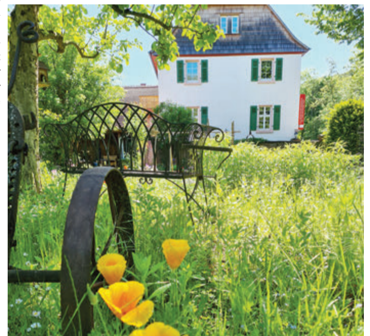
Ein Blick von Außen vom Garten auf das Gebäude.

Groß-Umstadt. Das Groß-Umstädter Museum hat nun eintrittsfrei jeden Sonntag von 13 bis 18 Uhr geöffnet. Diesen Sonntag (26. Juni) jedoch bleibt das Museum wegen des Johannistags geschlossen. Besucher können durch die teilweise neu gestalteten oder neu geordneten Ausstellungsräume schreiten, die komplett neue Abteilung zum Thema „Groß-Umstadt nach 1945“ entdecken und frühere Zeiten neu erfahren. Der Verein bittet ausdrücklich darum, respektvoll mit den Ausstellungsgegenständen umzugehen, sie nicht mitzunehmen oder anzufassen. Besonders ist auf die Kinder zu achten. Hinter dem Gruberhof, in der Straße Am Herrnberg sind Stellplätze vorhanden, der Verein bittet darum, nicht an der Landesstraße im Raibacher Tal und nicht auf dem Bürgersteig zu parken. Die Museumsaufsicht steht für Fragen und Erläuterungen zur Verfügung. Auch das Museumscfé im ehemaligen Kuhstall ist geöffnet. Zusätzlich wird jeden ersten Sonntag im Monat ein „Handarbeitscafé“ mit Stricken, Häkeln, Nähen und Spinnen angeboten. Jeden zweiten Sonntag im Monat hingegen hat das Reparaturcafé geöffnet. Kleingeräte unter fachlicher Anleitung selbst reparieren, statt sie wegzuworfen, das ist Ziel an diesem Tag. Mehr Informationen auf der Website: www.gruberhof-museum.de red