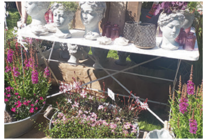
Eine kleine, feine Impression vom Odenwald Country Fair bei Eulbach.

Die Getreidebauern im Odenwald, beschreibt er weiter, seien nicht in der Lage, so viel zu bewässern, wie beispielsweise im Ried. „Der Odenwald ist ein benachteiligtes Gebiet.“ Dafür seien die Pflanzen hier „härter im Nehmen“, also nicht so ertragreich, dafür aber robuster. „Viele Landwirte haben bereits Heu gemacht und hoffen auf Regen. Wenn es jetzt nicht regnet, brennt der Boden aus“, prognostiziert Trumpheller abschließend. Clarissa Yigit