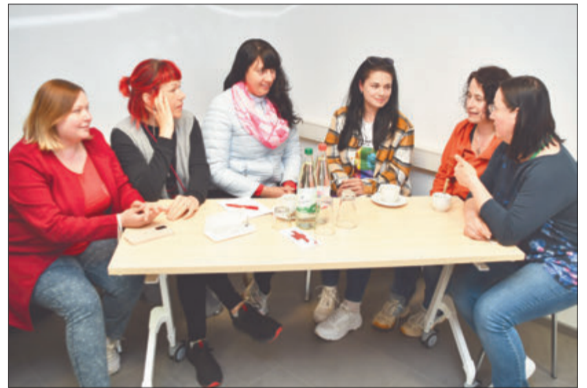
Ukrainerinnen und Deutsche beim Kennenlernen während des ersten Treffens des Hilfsprojektes unter Federführung des Roten Kreuzes.

Informationsaustausch bei Kochen und Kinderbetreuung angedacht