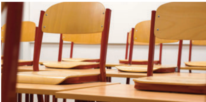
Stühle werden gerückt in der Ernst-Göbel-Schule.