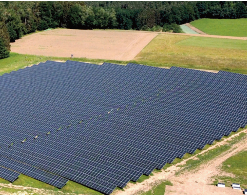
Der Solarzellenpark bei Unter-Mossau.