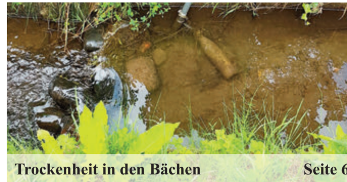
Trockenheit in den Bächen Seite 6

Geld für die Sanierung: Hofreite in Lengfeld kann weiter restauriert werden Seite 6