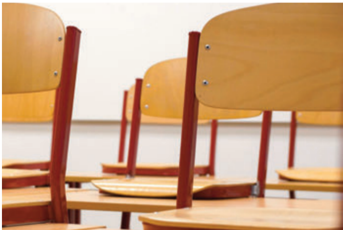
Stühle werden gerückt in der Ernst-Göbel-Schule.