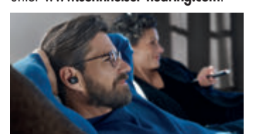
Sonova Consumer Hearing GmbH, Am Labor 1, 30900 Wedemark, Deutschland

Die TV Clear App führt Nutzer*innen intuitiv durch die Einstellungen, berücksichtigt die persönlichen Vorlieben und sorgt so für ein individuelles Hörerlebnis. Der Akku bietet bei Verwendung des Senders bis zu 15 Stunden Laufzeit. Das Sennheiser TV Clear Set ist ab sofort zu einem UVP von 399,90 Euro erhältlich. Mehr Infos unter www.sennheiser-hearing.com .