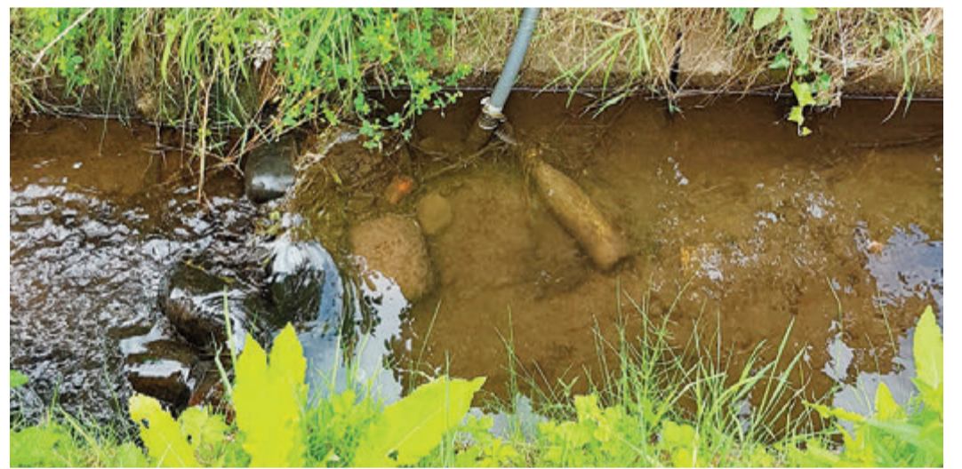
Illegale Wasserentnahme in Heubach