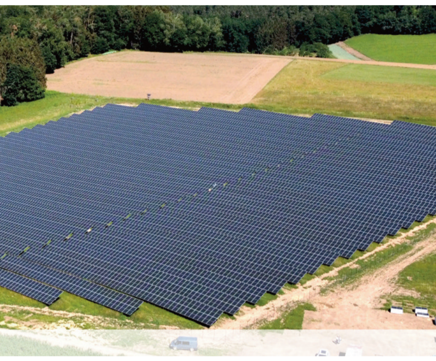
Der Solarzellenpark bei Unter-Mossau.