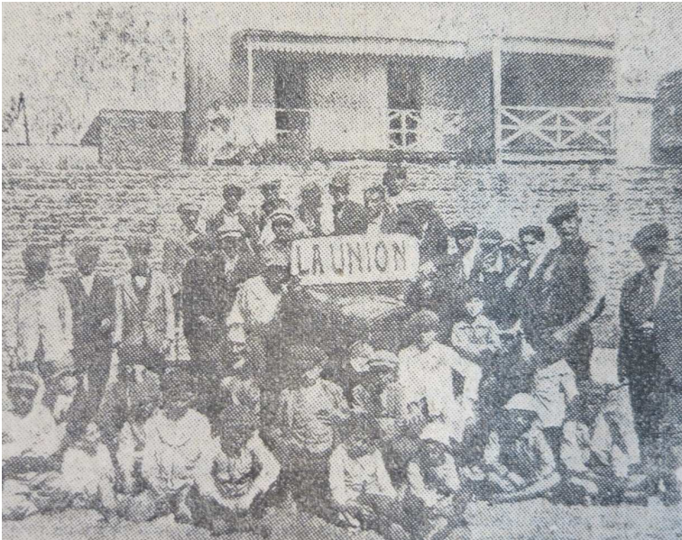
Abb. 2: Die Zeitungsjungen der Unión in Mar del Plata. Das Auto diente der Verteilung der Zeitung.