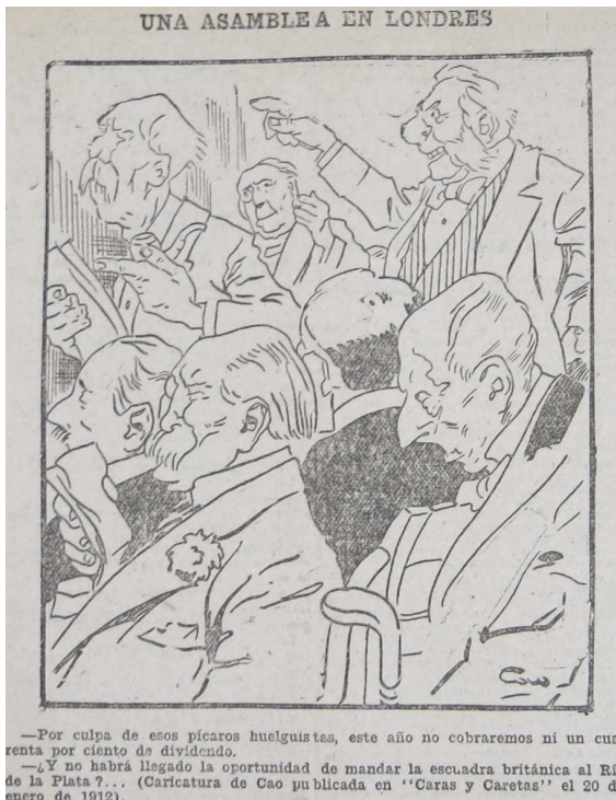
Abb. 4: Eine Versammlung in London. Der Arbeiterstreik gefährde die Dividenden, weshalb die Entsendung eines britischen Geschwaders an den La Plata überlegt werde. Wiederabdruck einer Karikatur aus Caras y Caretas , Buenos Aires, vom 20. Januar 1912. Quelle: La Unión , Buenos Aires, 05.11.1917, S. 5.

Die Unión hatte bereits in den Jahren vor 1916 die schwelenden Konflikte bei den Bahn- und Gefrierfleischindustriearbeitern für ihre Zwecke instrumentalisiert. Der Artikel Explotación incalificable de 4.000 obreros. El frigorífico La Plata Cold Storage tiene implantado un régimen de terror erweckte den Anschein, eine investigative Reportage zu sein, die einen Skandal um menschenunwürdige Arbeitsbedingungen in der englischen Firma aufdeckte: