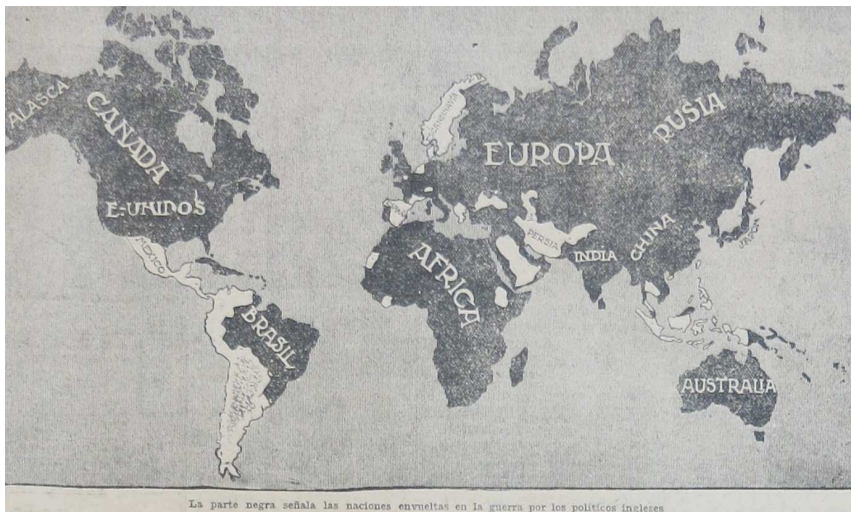
Abb. 3: Gezeichnete Weltkarte. Die schwarz gefärbten Teile sollen die Nationen anzeigen, die sich von den englischen Politikern in den Krieg hätten ziehen lassen.

Eine solche Karte hing zum Beispiel in der Deutschen Buchhandlung in Mexiko D.F. aus, was der Gegenseite ein Dorn im Auge war: