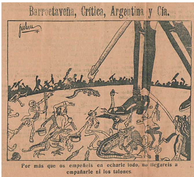
Abb. 1: Im schmutzigen Pressekrieg kann die alliiertenfreundliche argentinische Presse dem deutschen Militärstiefel nicht einmal die Hacken besudeln.

Die größten argentinischen Tageszeitungen, zu denen zum Beispiel La Nación gehörte, ergriffen nach dem Überfall des Deutschen Reiches auf Belgien deutlich Partei für die Sache der Entente. 480 Ursache für die der Entente freundlich gesinnte Stimmung war hierbei nicht nur der Umstand, dass diese Zeitungen hauptsächlich den Dienst der französischen Havas erhielten, sondern auch, dass sich ein Großteil der argentinischen Öffentlichkeit mit dem Schicksal Belgiens identifizieren konnte. 481 Hinzu kamen frankophile Sympathien, die von vielen Argentinern geteilt wurden. 482 Diese Faktoren erleichterten es der Entente, eine bereits positiv voreingestellte Öffentlichkeit vom Wahrheitsgehalt ihrer lancierten Propagandakampagnen zu überzeugen. Ein rasches Handeln schien von deutscher