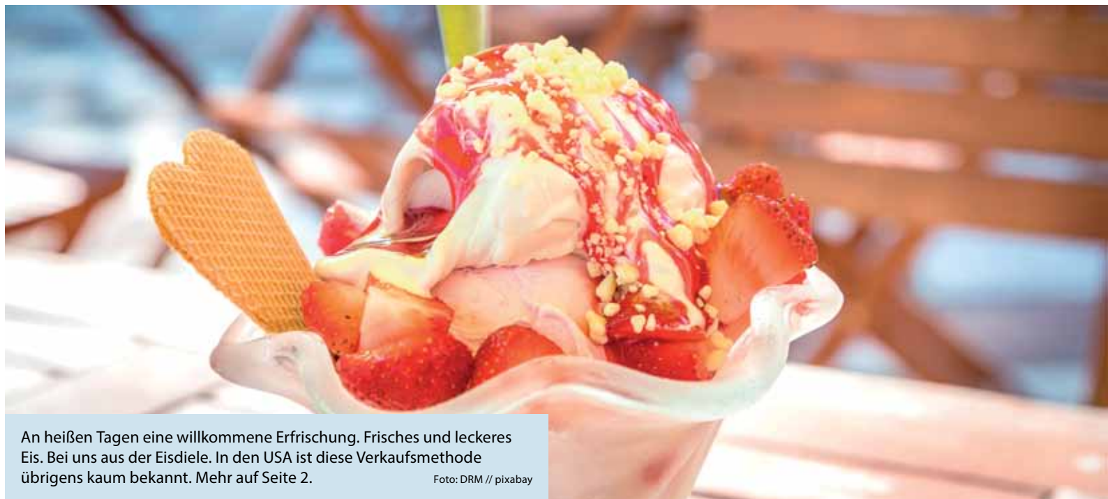
An heißen Tagen eine willkommene Erfrischung. Frisches und leckeres Eis. Bei uns aus der Eisdiele. In den USA ist diese Verkaufsmethode übrigens kaum bekannt. Mehr auf Seite 2.