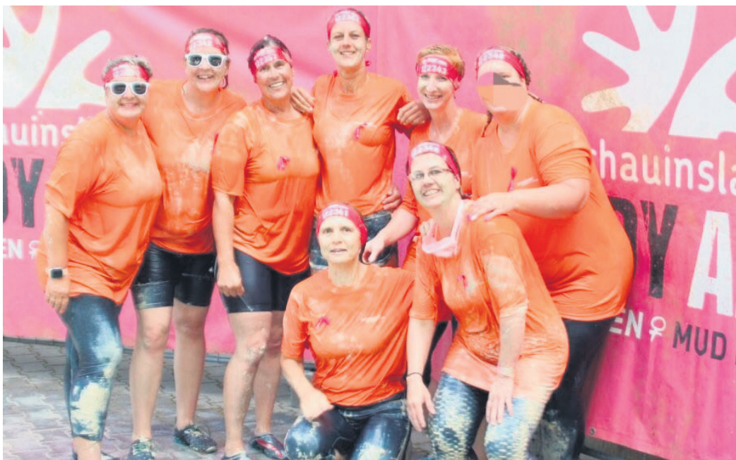
Voller Einsatz und gutgelaunt für die gute Sache: die Gude-Steine-Mädels.

gestärkt. Das Ziel war nicht, schnell ins Ziel zu kommen, sondern gemeinsam. So, wie man eben auch durch eine Krebserkrankung kommt, durch die Hilfe nahestehender Menschen. Die acht schlammigen Engel hatten für ihren Einsatz T-Shirts von der Firma Primogart aus Rodgau gesponsert bekommen.