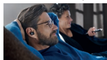
Sonova Consumer Hearing GmbH, Am Labor 1, 30900 Wedemark, Deutschland

Die TV Clear App führt Nutzer*innen intuitiv durch die Einstellungen, berücksichtigt die persönlichen Vorlieben und sorgt so für ein individuelles Hörerlebnis. Der Akku bietet bei Verwendung des Senders bis zu 15 Stunden Laufzeit. Das Sennheiser TV Clear Set ist ab sofort zu einem UVP von 399,90 Euro erhältlich. Mehr Infos unter www.sennheiser-hearing.com .