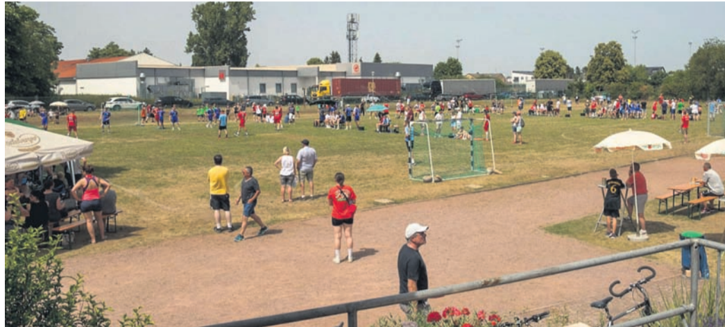
Trotz zwei Jahren Pandemie bedingter Pause, hat die Lust auf Feld-Handball unter freiem Himmel offenbar nicht abgenommen.