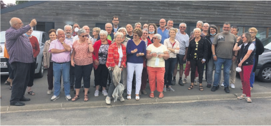
Die Rodgauer zu Besuch in Puiseaux.