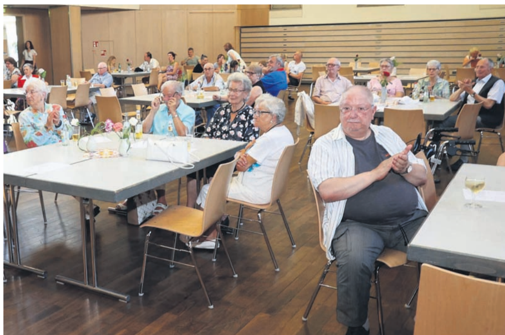
Neben Ansprachen und Ehrungen gab es ein buntes Unterhaltungsprogramm für die Gäste.

Rodgau (ah) 1945 endete der Zweite Weltkrieg und schon 1946 wurde der „Verband der Körperbehinderten, Arbeitsinvaliden und Hinterbliebenen für Groß-Hessen“ (VdK) als Selbsthilfegruppe von den Behörden zugelassen.