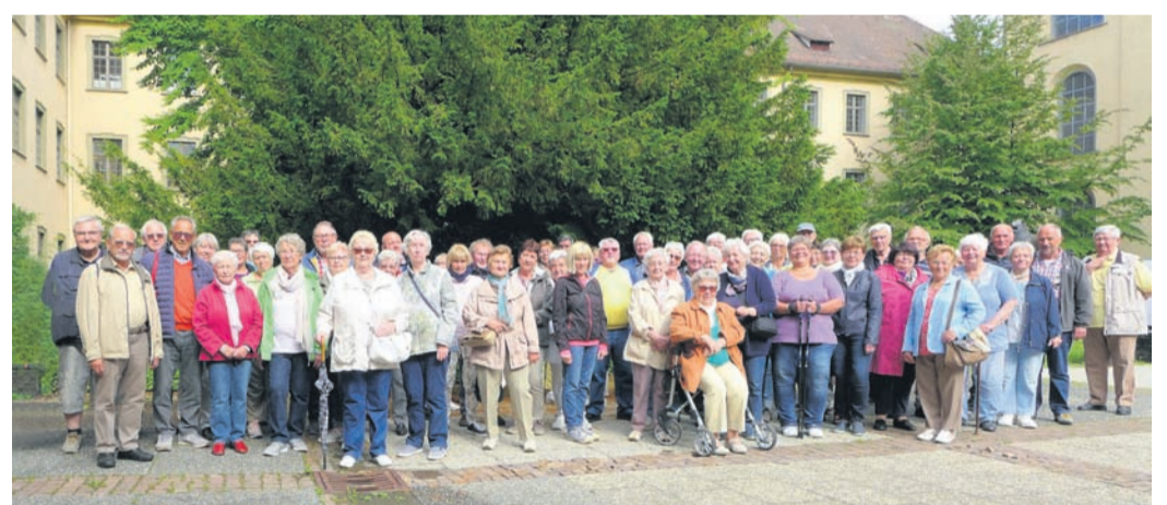
Die Jügesheimer Kolpinger auf Bodenseereise.

„Bei den Implantaten haben sich in letzter Zeit wesentliche Verbesserungen ergeben. Immer öfter können die Gelenkprothesen durch eine minimalinvasive Operation, im Bereich der Schulter zum Teil sogar über eine Gelenkspiegelung, eingebracht werden. In unserer Klinik werden solche minimalinvasiven Verfahren routinemäßig angewendet. Zudem ersetzen wir stets ganz selektiv und patientenindividuell ausschließlich den von der Arthrose zerstörten Gelenkabschnitt. Dies verkleinert den Eingriff, verkürzt die Rehabilitation und macht damit die Wiederaufnahme von Beruf oder Sport rascher wieder möglich“, so Dr. Eisenbeis.