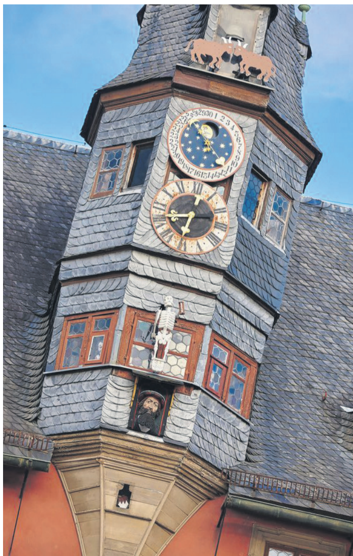
Das Lanzentürmchen auf dem Dach des Neuen Rathauses ist das Wahrzeichen der Stadt Ochsenfurt.