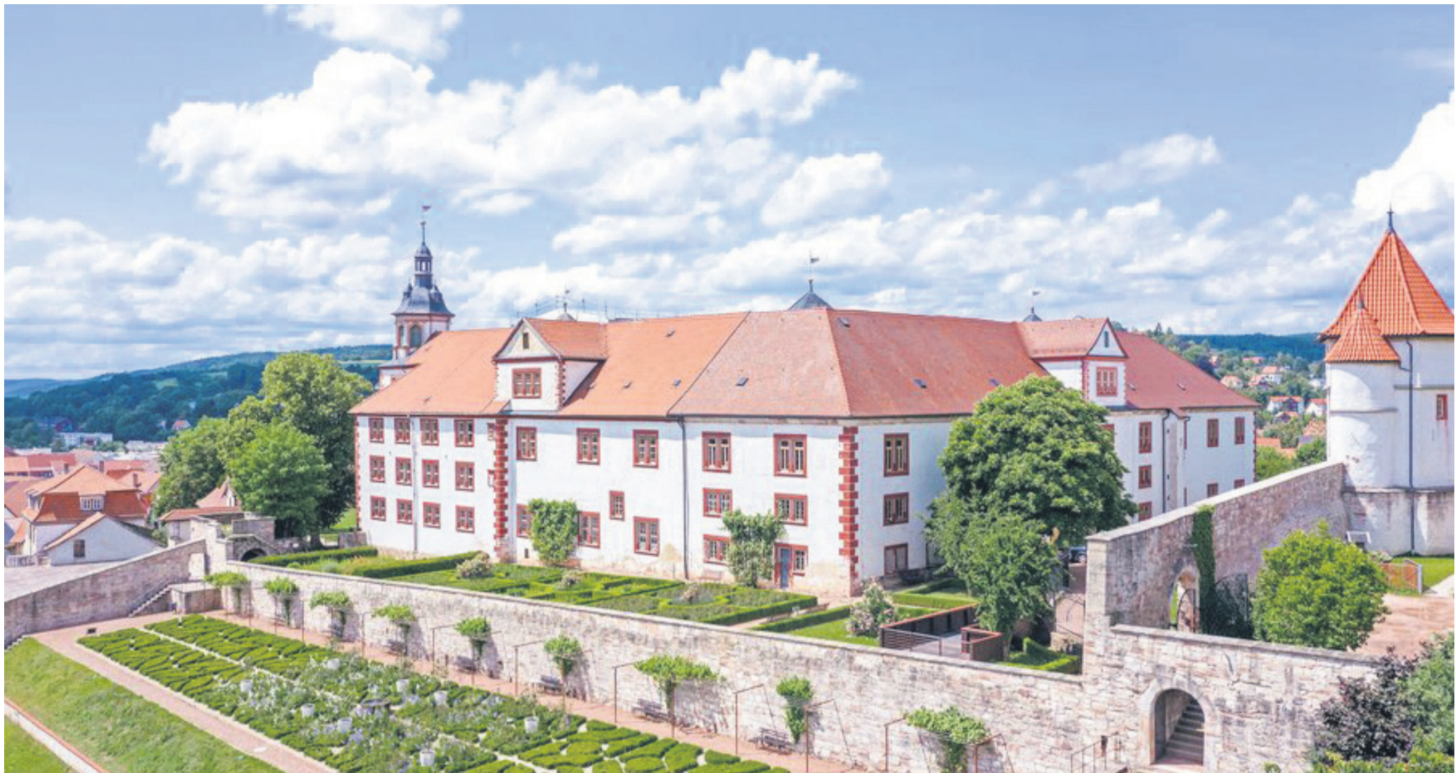
Schmallkalden: Das Schloss Wilhelmsburg ist eine Perle unter den Renaissanceschlössern.