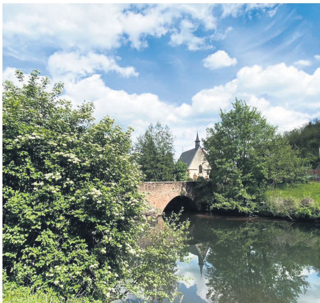
Ein Kleinod am Ortsrand von Miltenberg ist die 1380 erstmals erwähnte Laurentiuskapelle. Nach telefonischer Absprache mit dem Katholischen Pfarramt können Gäste einen Besichtigungstermin vereinbaren.

Manche Schätze sind tief verborgen. Zum Beispiel im „steinreichen“ Bad Langensalza. Etwa einen Meter unter dem Pflaster der thüringischen Stadt liegt der über Jahrtausende gewachsene Travertin - auch Marmor des Nordens genannt. Aus dem porösen Kalkstein wurden bereits im Mittelalter Gebäude errichtet, welche heute noch stehen. Unter ihnen entstanden riesige Keller, die Gäste bei speziellen Kellerführungen besichtigen können. Schloss Wilhelmsburg in Schmallkalden, das liebevoll eingerichtete Haus der Zünfte in der Judengasse im hessischen Grünberg oder die Türmerwohnung im Kirchturm der Homberger Stadtkirche St. Marien: In den Städten entlang der Deutschen Fachwerkstraße locken viele weitere Schätze.