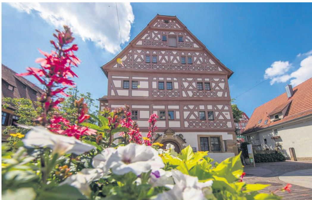
Das Stadtmuseum Hornmoldhaus beherbergt die stadtgeschichtliche Sammlung der Stadt Bietigheim-Bissingen.