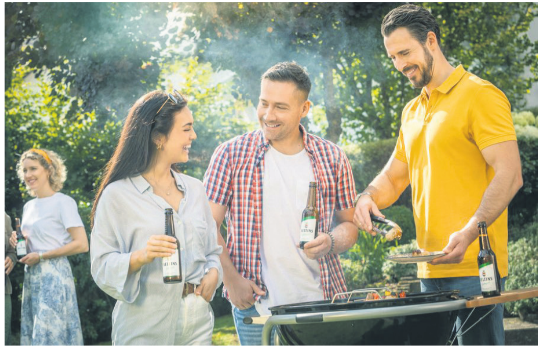
Kaum ein Vergnügen wird hierzulande in der warmen Jahreszeit mehr geschätzt als das gesellige Grillen mit Freunden.