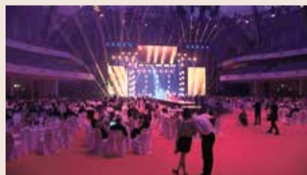
Verleihung der Live Entertainments Awards (LEA) in der Frankfurter Festhalle