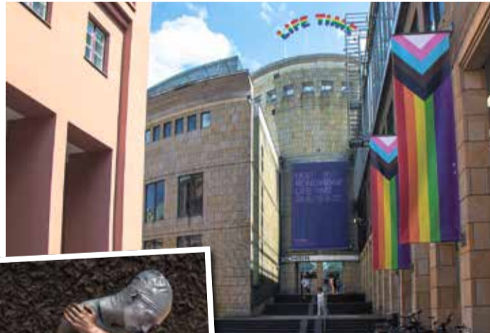
Die Leuchtinstallation von Ugo Rondinone über Schirn leuchtet farbenprächtig.