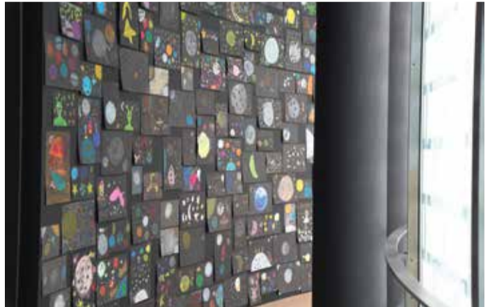
Fast 5.000 Kinder haben bei dem Projekt mitgemacht. Die Rotunde ist komplett mit den Zeichnungen ausgestattet und an den Türen sind alle kleinen Künstler namentlich genannt.

Die Ausstellung „LIFE TIME“ verbindet wesentliche Themen, die Ugo Rondinones Werk seit