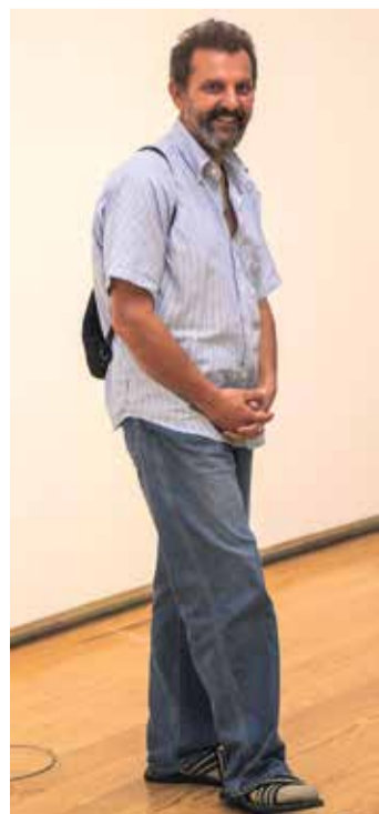
Der Künstler in den Ausstellungsräumen.