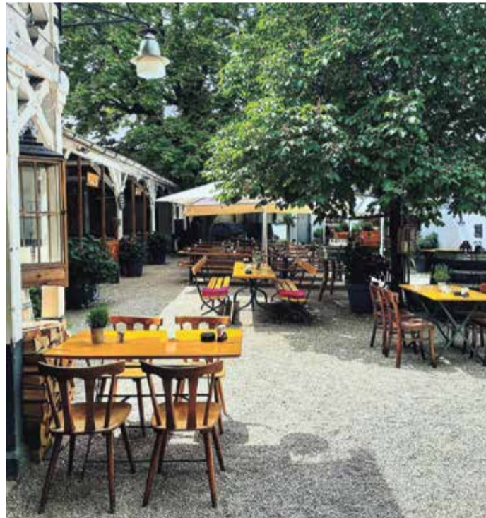
Der idyllische Innenhof des Apfelweinkellers „Zum Rad“.

Bereits seit 1806 besteht das Lokal im Seckbacher Ortskern und ist somit das älteste Apfelweinkelokal mit hauseigener Kelterei in Frankfurt. Die Gerichte sind saisonal abgestimmt und werden mit frischen Produkten aus der Region zubereitet. Das Restaurant verfügt über zahlreiche Sitzgelegenheiten im Innen- und Außenbereich. In den Sommermonaten genießen Sie Ihren „Ebbelwoi“ im großen Innenhof. Ein wunderbarer Ort, um in geselliger Runde zu dinieren. Aber auch wenn es kalt ist, bietet das Lokal immer ein gemütliches