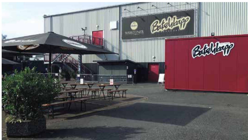
Normalerweise gut besucht, die Batschkapp im Süden Seckbachs

Zustellhotline: Montag – Freitag 8:00 – 16:30 Uhr: 06104-4970-0