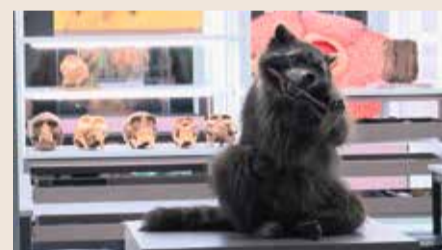
Aha?! Forschungswerkstatt im Senckenberg Naturmuseum Frankfurt

er alleine forscht oder mit fachkompetenter Unterstützung. So gibt es so genannte Wissenschaftsvermittler*Innen, also Biologen und Geologen, die fundierte Antworten geben und die Besucher anleiten können. Aber auch Präsentationen von Wissenschaftlerinnen und Wissenschaftlern des Senckenberg Museums gehören zum Programm der Forschungswerkstatt. Zum Beispiel in Form von einer Live-Schleife zu einer Grabung in der Grube Messel oder in ein Labor. Geöffnet hat die Aha?! Forschungswerkstatt im Senckenberg Naturmuseum Frankfurt von dienstags bis sonntags.