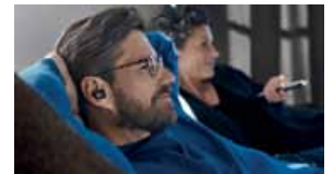
Sonova Consumer Hearing GmbH, Am Labor 1, 30900 Wedemark, Deutschland

Die TV Clear App führt Nutzer*innen intuitiv durch die Einstellungen, berücksichtigt die persönlichen Vorlieben und sorgt so für ein individuelles Hörerlebnis. Der Akku bietet bei Verwendung des Senders bis zu 15 Stunden Laufzeit. Das Sennheiser TV Clear Set ist ab sofort zu einem UVP von 399,90 Euro erhältlich. Mehr Infos unter www.sennheiser-hearing.com .