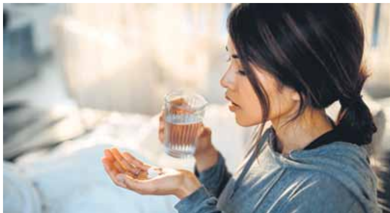
Welcher Wirkstoff den Schmerz am besten bekämpft, ist individuell unterschiedlich.

Deshalb ist es gut, dass es nicht nur einen verfügbaren Schmerzmittelwirkstoff gibt, sondern mehrere. Doch welchen man auch immer wählt: Durch den Zusatz von Koffein lässt sich der Effekt noch steigern. Hier haben sich zum Beispiel Kombinationen aus ASS, Paracetamol und Koffein wie in Thomapyrin Classic und Intensiv oder aus Ibuprofen und Koffein in Thomapyrin Tension Duo bewährt. Koffein kann die Schmerzhemmung im zentralen Nervensystem verstärken, indem es an speziellen Rezeptoren andockt, die für die Steuerung von Erregungsprozessen zuständig sind. Wer sich außerdem ein bisschen Ruhe gönnt fühlt sich in der Regel schnell besser. Bei Spannungskopfweh hilft aber oft auch Bewegung.