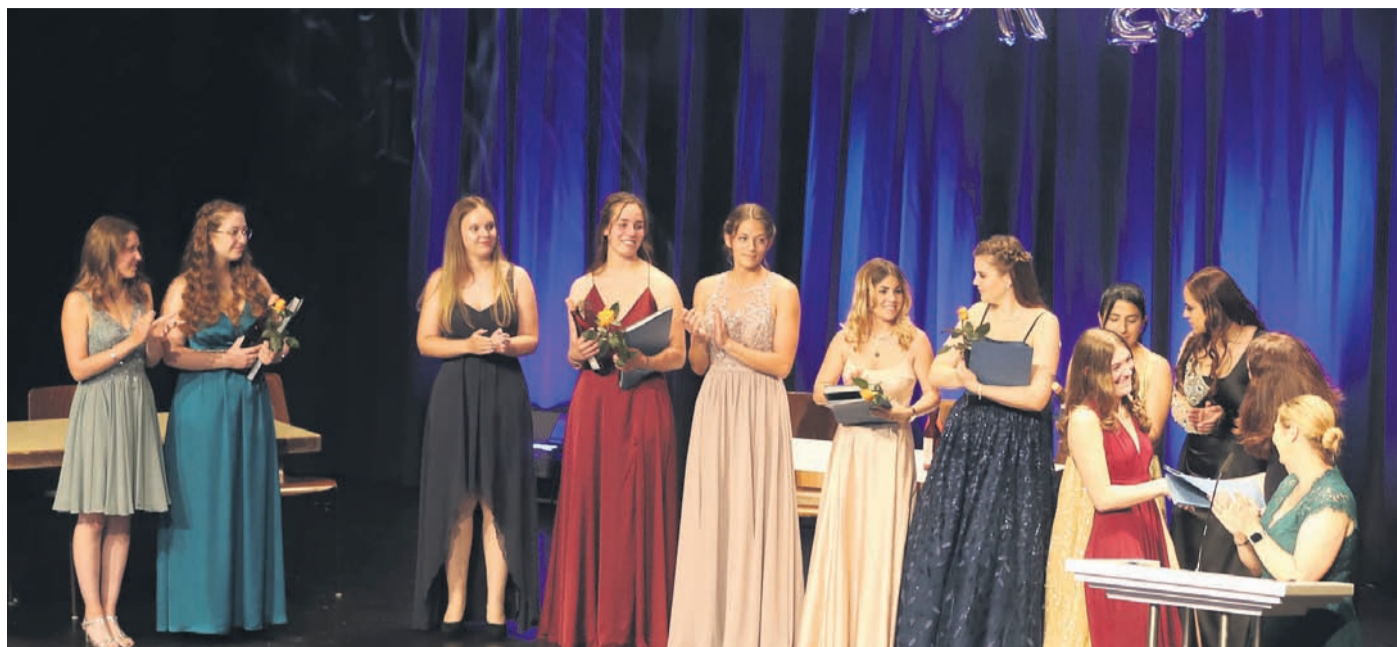
Die Übergabe der Abi-Zeugnisse, hier an die 13a, war der Höhepunkt der Feier.