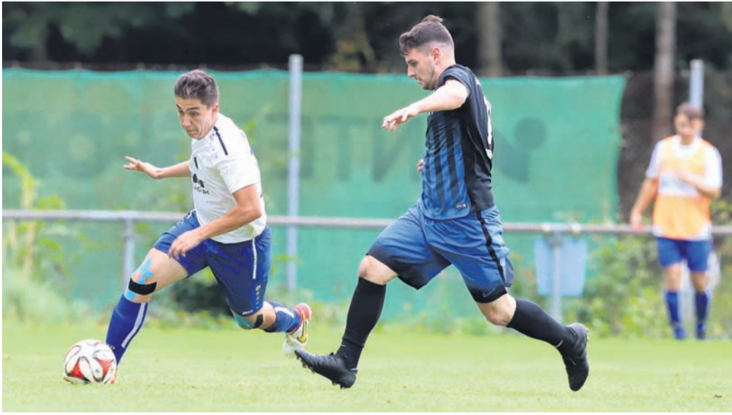
Durch den Abstieg der Viktoria am „Grünen Tisch“ wird es das Rödermark-Derby zwischen den Urberachern und der zweiten Mannschaft der Germania, hier ein Bild aus dem Hinspiel der vergangenen Saison, erst einmal nicht wieder geben.