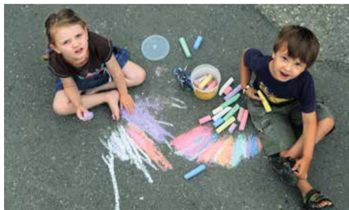
Kleine und große Künstler sind gefragt – bei der Mitmachbildaktion der Eurobike City.

Start ist am Mittwoch, der 13. Juli um 14 Uhr. Bis 16 Uhr kann man an diesem Tag sogar zusammen mit dem Künstler das Bild ausmalen. Ende der Aktion ist Freitagabend (15. Juli) um 21 Uhr.