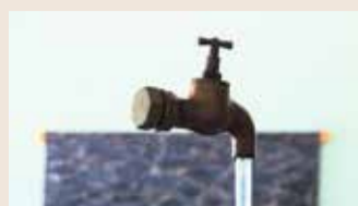
Sonderausstellung „virtuelles Wasser“ im EXPERIMINTA ScienceCenter.

virtuelles Wasser läuft noch bis zum 24. Juli.