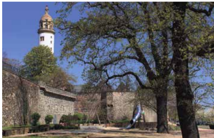
Der Turm des „Alten Schlosses“ ist bereits von Weitem gut zu erkennen

Die Hoechst GmbH hat es geschafft, den gleichnamigen Stadtteil auf der ganzen Welt bekannt zu machen. Der Konzern gehört heute noch zu einem der drei größten Chemie- und Pharmakonzern Deutschlands. 1863 gründeten