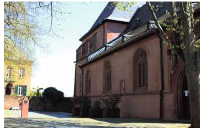
Am Eingang zur Justinuskirche findet sich Jesus am Kreuz.

1925 schloss sich die Hoechst AG durch eine Fusion der I.G. Farbenindustrie AG an. Dies hatte jedoch auch zur Folge, dass zur Zeit des Nationalsozialismus die Gleichschaltung der I.G. Farben auch auf die Höchst AG umschlug. Alle jüdischen Mitarbeiter mussten zwischen 1933 und 1938 das Werk verlassen. Auch die jüdischen Aufsichtsratsmitglieder wurden aus ihren Ämtern vertrieben. Zahlreiche Mitarbeiter wurden in den Kriegsdienst eingezogen und durch Zwangsarbeiter und Kriegsgefangene ersetzt. Die Kriegsergebnisse zogen das Werk kaum in Mitleidenschaft. 1951 kam es zur Entflechtung der I.G. Farbenindustrie AG und der anschließenden Neugründung. Dafür wurde ein neues Firmenemblem bestehend aus Turm und Brücke entworfen, das heute noch genutzt wird. Von 1974 bis 2005 trugen die Farbwerke Hoechst den Namen Hoechst AG, im Oktober und nach der Übernahme durch die Sanofi-Gruppe, wurde die Aktiengesellschaft in eine GmbH umgewandelt. Neben dem Stammwerk in Höchst gab es zwischenzeitlich bis zu 14 weitere Werke, die als Betriebsstätten dazugehörten.