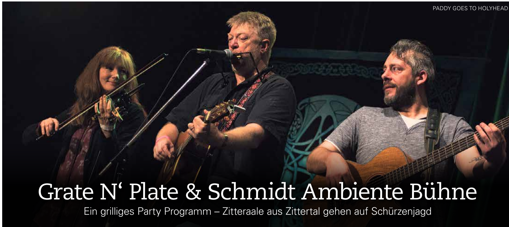
PADDY GOES TO HOLYHEAD