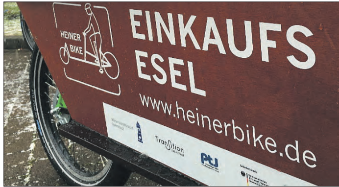
HEINERBIKE – eine absolute Erfolgsgeschichte aus Darmstadt.

DARMSTADT – Über die menschengemachte Klimakrise reden ist wichtig, etwas dagegen tun ist noch viel wichtiger. Das gilt ganz besonders für den Mobilitätsbereich. Lastenräder ausleihen ist nachhaltig, gesund und macht Spaß.