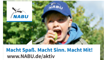
Macht Spaß. Macht Sinn. Macht Mit! www.NABU.de/aktiv

Auf dem Marktplatz am Medienschiiff wird an diesem Tag das Finalturnier der 3x3 LOTTO Hessen-Tour 2022 im Basketball ausgetragen. (PS)