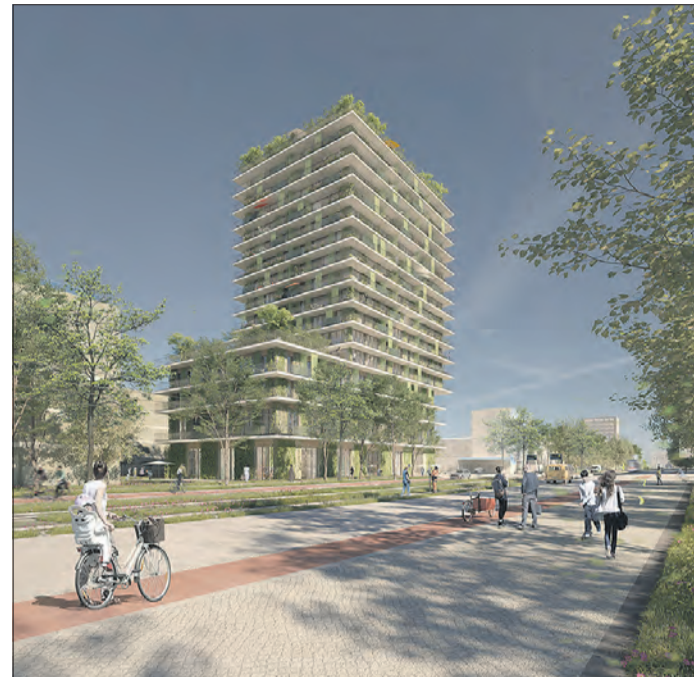
DER SIEGERENTWURF zum Hochhaus, das auf dem Marienplatz in Darmstadt gebaut werden soll. (Grafik: luxfeld digital art)

Im Hochhaus sind hauptsächlich Wohnungen geplant. Im Erdgeschoss sind ein Nahversorger sowie eine kleine Gastronomie-Fläche geplant, in dem darüberliegenden Geschoss wird es Büro-Flächen geben.