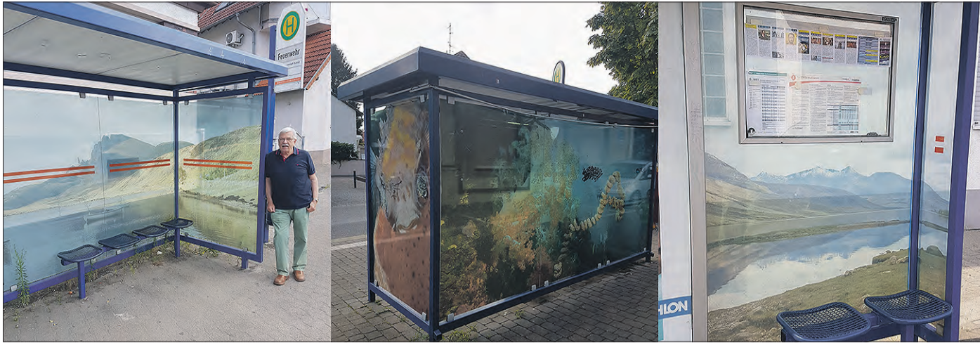
IN DIE FERNE BLICKEN – Von links: Wulff-Joachim Olschock an der Haltestelle Feuerwehr in Schneppenhausen, Haltestelle Postplatz in Gräfenhausen und nochmal Haltestelle Feuerwehr in Schneppenhausen.

Projekt der Stadt Weiterstadt mit Wulff-Joachim Olschock