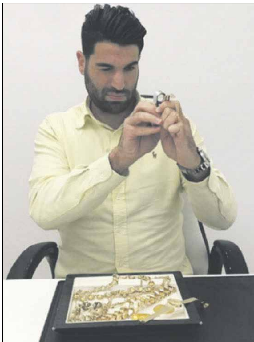
Ihr Spezialist für Goldankauf.