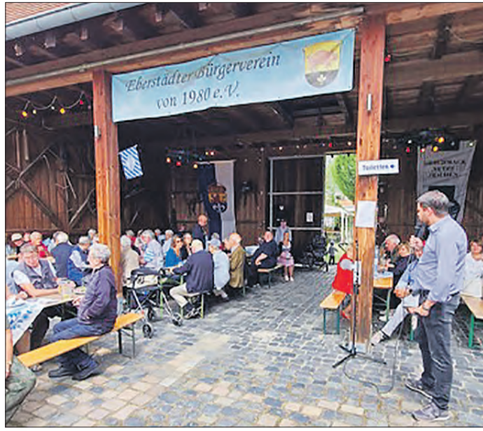
ZAHLEICHIGE GÄSTE beim Sommerfest der CDU Eberstadt.

Den Bürgerinnen und Bürgern konnten dabei wieder allerhand bayerische Spezialitäten – von der Weißwurst bis zum selbstgemachten Obatzda – geboten werden. Neben Live-Musik gab es auch in diesem Jahr wieder tolle Preise bei der Tombola zu gewinnen. Die Preise hierfür