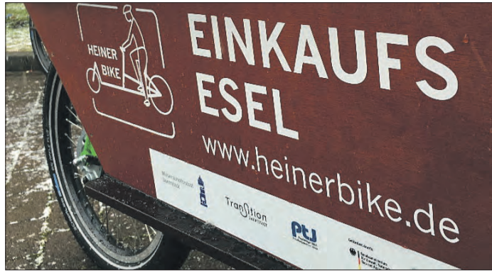
HEINERBIKE – eine absolute Erfolgsgeschichte aus Darmstadt.

DARMSTADT – Über die menschengemachte Klimakrise reden ist wichtig, etwas dagegen tun ist noch viel wichtiger. Das gilt ganz besonders für den Mobilitätsbereich. Lastenräder ausleihen ist nachhaltig, gesund und macht Spaß.