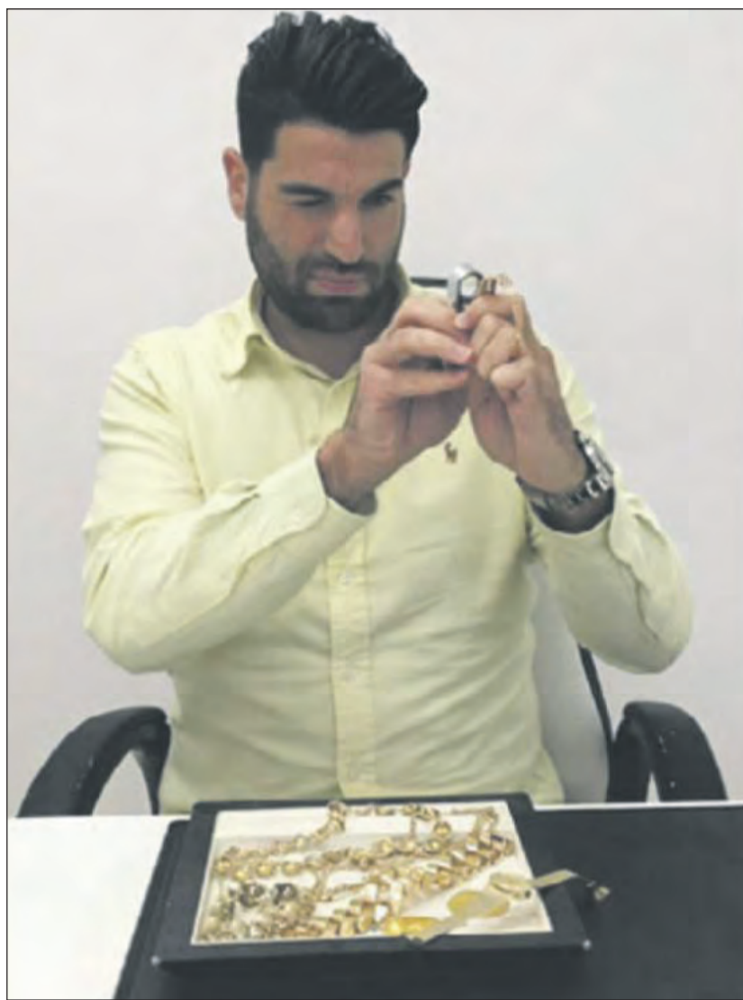
Ihr Spezialist für Goldankauf.