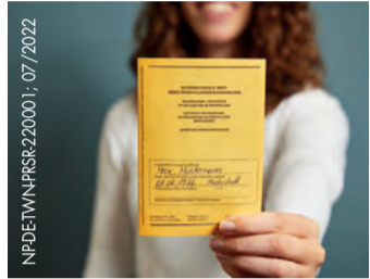
NPDETWINPRGR220001 - 07/2022

ein Hepatitis-Check durchgeführt und der Impfstatus überprüft werden. Denn gegen Hepatitis A und B gibt es seit Jahrzehnten gut verträgliche und wirksame Impfstoffe. Ist eine Auslandsreise geplant, können die Impfungen oftmals als Reiseimpfung durchgeführt und von der Krankenkasse erstattet werden. Zusätzlich können bei dem Termin auch die Standardimpfungen Covid-Booster, Tetanus, Diphtherie, Pertussis, Influenza sowie Gürtelrose und Pneumokokken bei den über 60-Jährigen aufgefrischt werden. Eine Arztbesuche findet man unter bereit-zu-reisen.de . (GlaxoSmithKline)