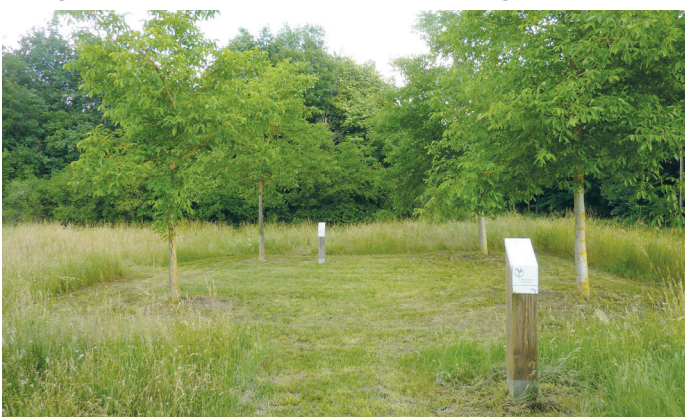
(5) Wiesental Walnußquartier.

Das Walnussquartier am Bachgrund nahe beim Wiesental ist ein Teil des Regionalpark-Netzwerks Rhein-Main. Das Quartier besteht aus insgesamt sechs Baumgruppen mit jeweils vier Walnussbäumen. Sitzgelegenheiten und Spielmöglichkeiten laden zum Verweilen ein. Infostelen erzählen mehr über die forstwirtschaftliche, mythisch-rituelle und medizinische Bedeutung der Walnuss. Dieser Baum des Jahres 2008 ist ein typischer Vertreter der heimischen Kulturlandschaft. Südlich davon am gleichen Weg liegt der Golfplatz Bachgrund. Die Anlage lohnt einen Abstecher oder einen eigenen Besuch.