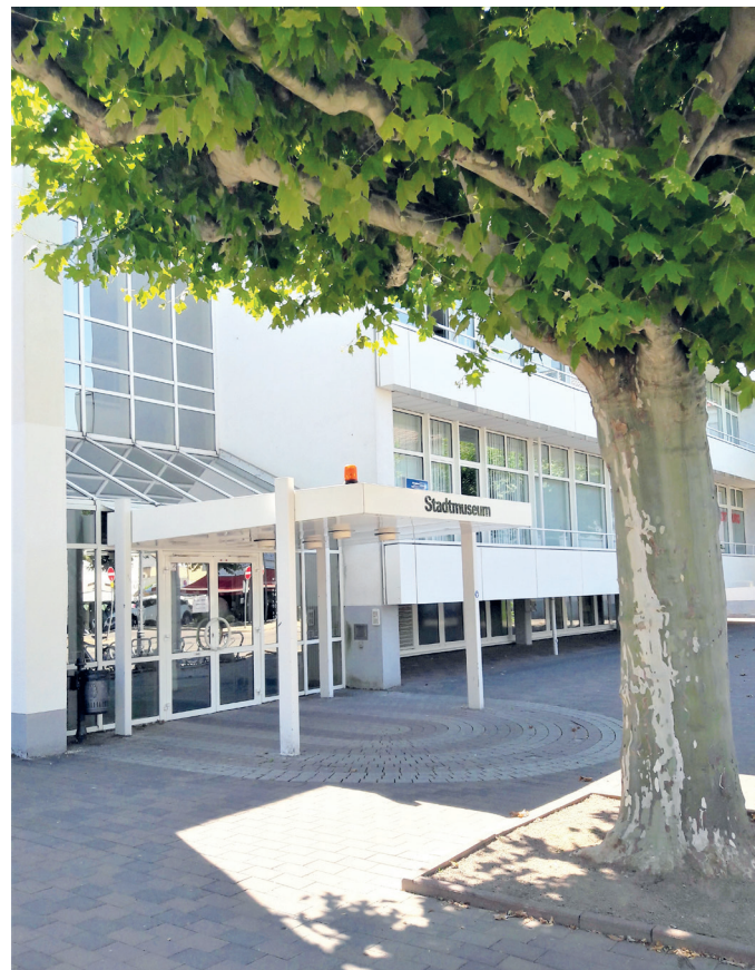
Abb. 1: Das Museum am Markt.