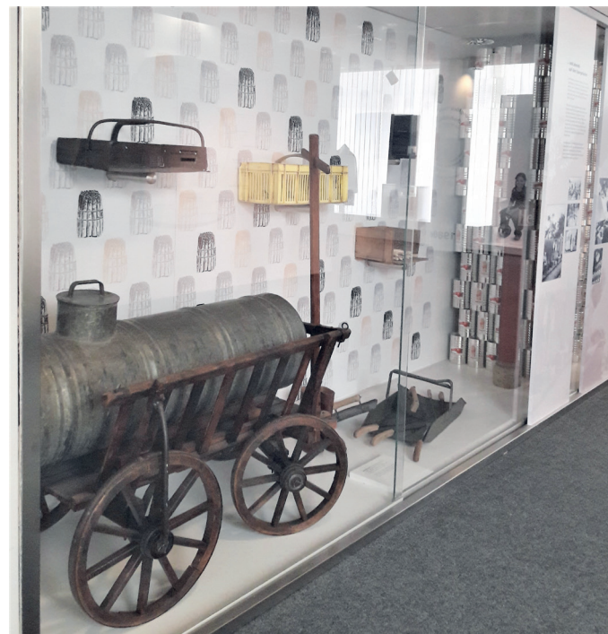
Abb. 2: Eine Vitrine ist dem einstmaligen mühsamen Spargelanbau gewidmet.