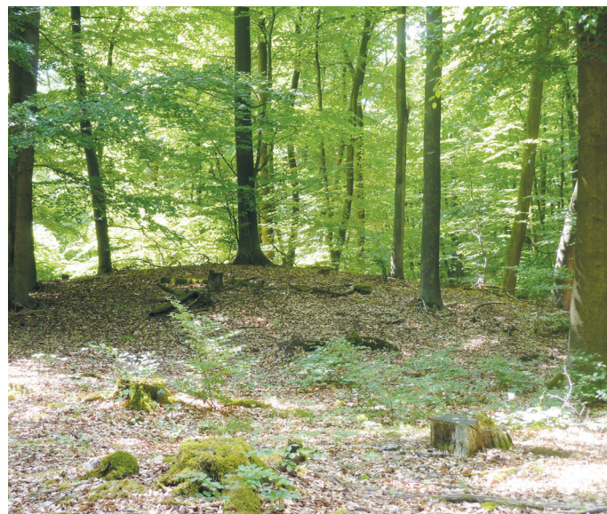
(1) Die geheimnisvollen Hügelgräber – ein Highlight!

Es kann angenommen werden, dass die bronzezeitlichen Erbauer für ihre Totenstätten auch vorhandene Flugsanddünen nutzten und deren Gipfel überhöhten oder auf nahe Sandlager zurückgriffen. Auf das sandige Umfeld weisen die Kiefernbestände des Waldes hin. Die Verstorbenen bettete man auf Bretter, um die sargähnliche Gehäuse errichtet wurden. Dann häuften man vermutlich mit Hilfe von Holzschaukeln, Eimern und obigen Geräten einen Hügel darüber an. Ältere Erzhäuser wussten zu berichten, dass sie dem großherzoglichen Hofrat Kofler um 1900 als Jugendliche bei Ausgrabungen helfen durften.