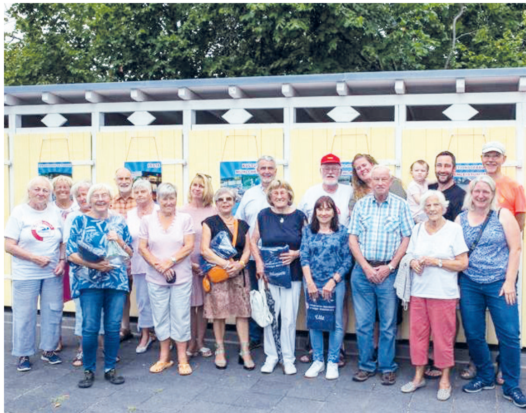
Zum 10-jährigen Jubiläum ehrt der Förderverein seine treuen, ersten und „ältesten“ Mitglieder.