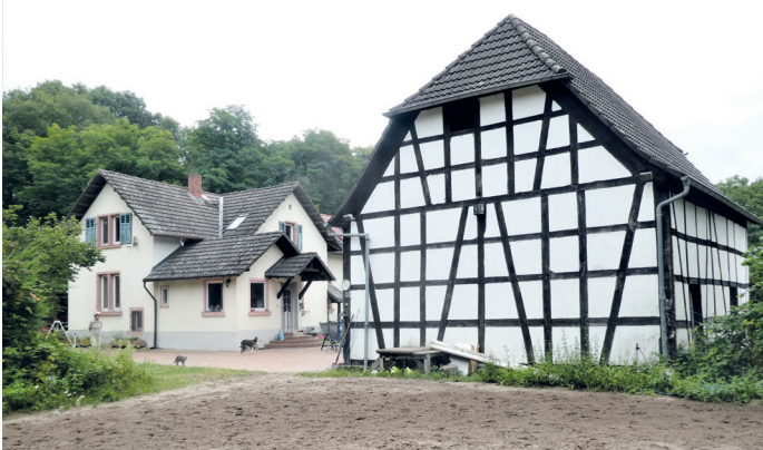
(3) Forsthaus Apfelbachbrücke.

Der Apfelbach nahebei hat keine Quelle, sondern entsteht aus einer Ableitung des Mühlbachs nahe der Hessenwaldschule. Dieser „Abfallbach“, daher der Namensursprung, sollte die zahlreichen Mühlen am Mühlbach vor Hochwasser schützen. Er fließt fast nur durch Wald zum Heegbachsee und hat daher den Beinamen Waldbach.