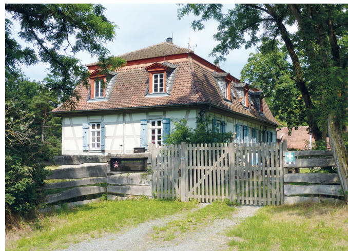
(6) Wiesental Forsthaus.

Wolfsgarten um 1723. Von der alten Pavillonanlage aus eingeschossigen Bauten steht nur noch das Forsthaus mitsamt einigen Wirtschaftsgebäuden. Es sind die Relikte einer einstmalig prunkvollen Herrschaftsherrlichkeit. Was für die Fürsten Pläsir war, gereichte den Bauern von Erzhausen zur Plage. Die Bauern mussten, wie zahlreiche Urkunden im Ortsarchiv belegen, nicht nur Frondienste als Jagdhelfer leisten, sondern zusehen, wie die Meute der Jagdgesellschaft bei der Jagd ihre Felder verwüstete und dabei so manche Ernte vernichtete.