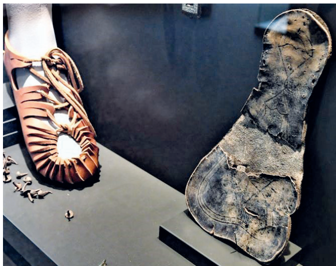
Abb. 3: Die Römer in Groß-Gerau.