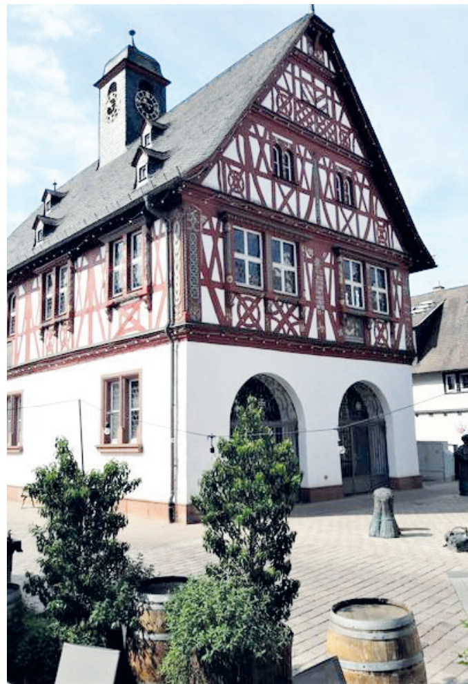
Abb. 4: Das historische Rathaus von 1578.