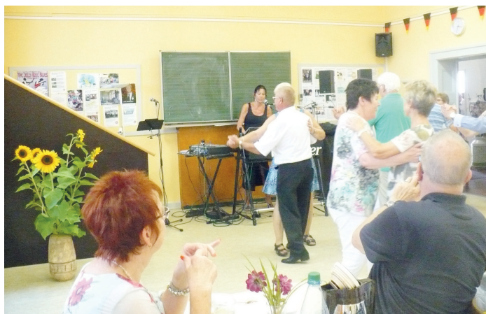
Der letzte Sommertanz.

(Wixhausen, EV) Am Donnerstag, dem 11.08.2022, ist von 14:00 bis 17:00 Uhr Sommertanz bei den Aktiven Senioren Wixhausen! Alle, die Freude am Tanzen haben, sind in die Begegnungsstätte Ostendstraße 27-29 eingeladen. Anfänger, Fortgeschrittene, langjährige Tanzpaare – jeder