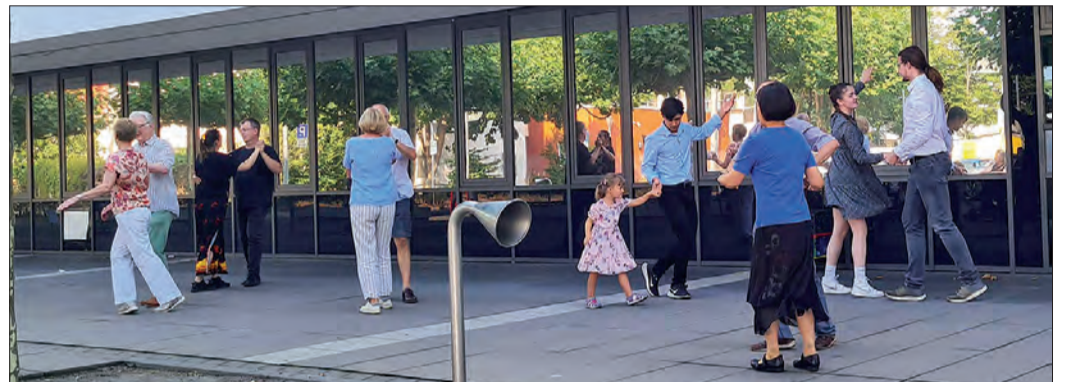
AUF DEM VERGANGENEN WOCHENMARKT gab es eine Tanzeinlage der Tanzsportabteilung der SG Weiterstadt.

Tanzsportabteilung der SG Weiterstadt präsentiert sich