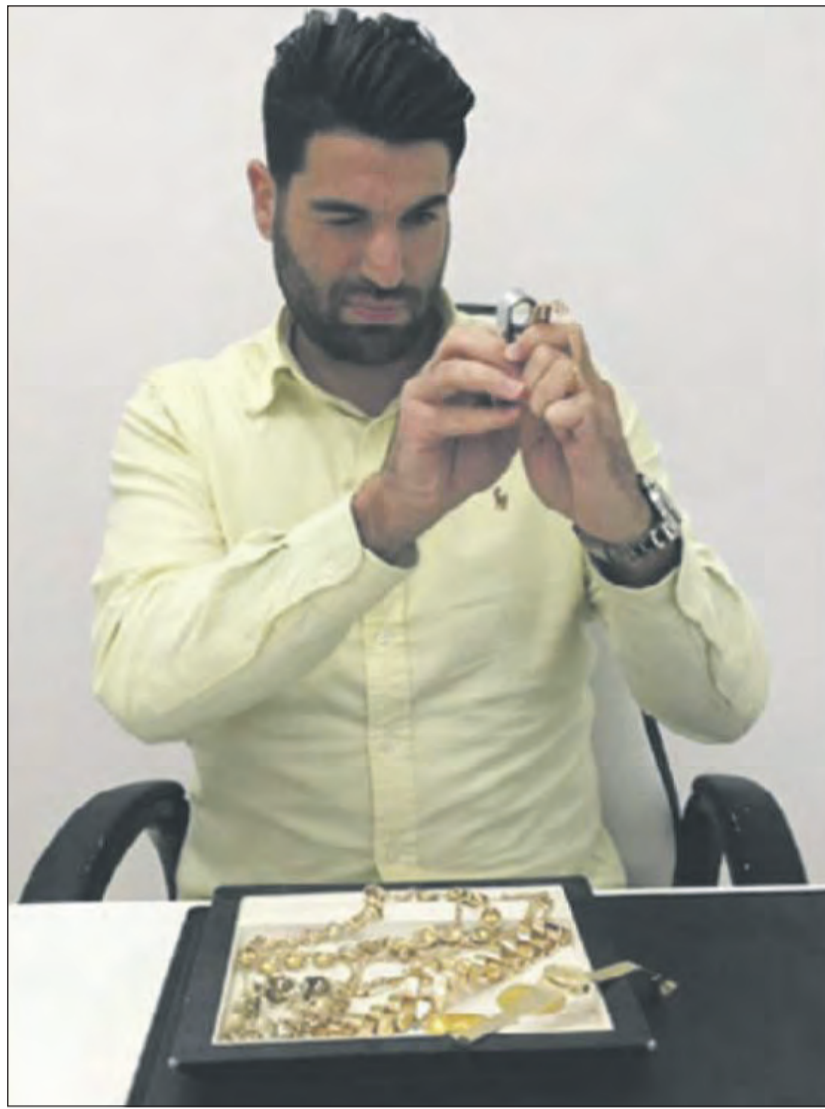
Ihr Spezialist für Goldankauf.