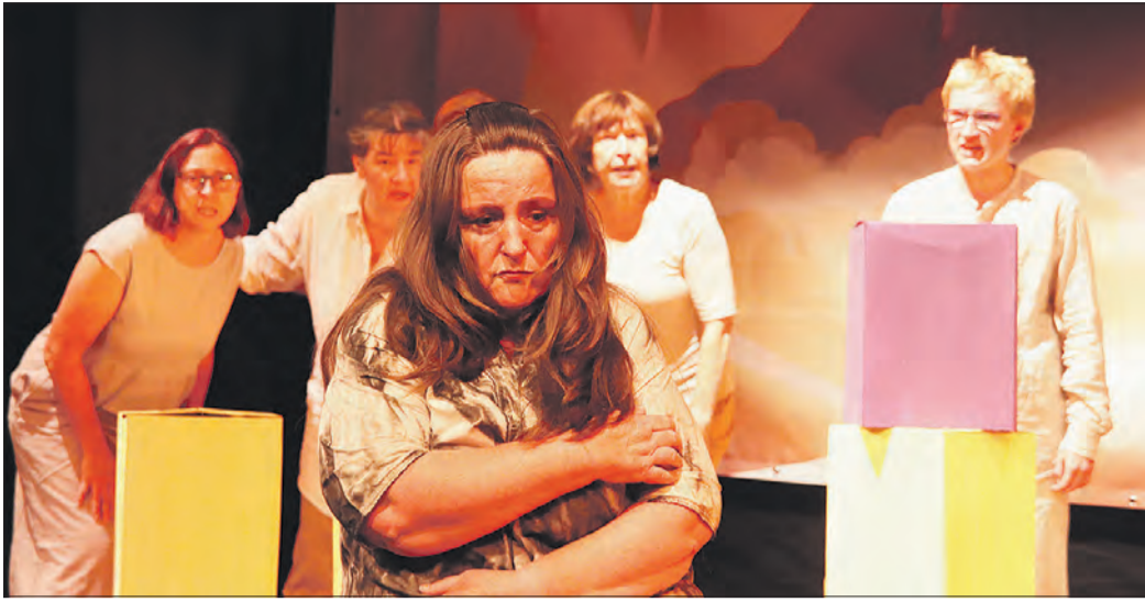
DAS PROJEKT „RUT“ wird im Ernst-Ludwig-Saal gezeigt.