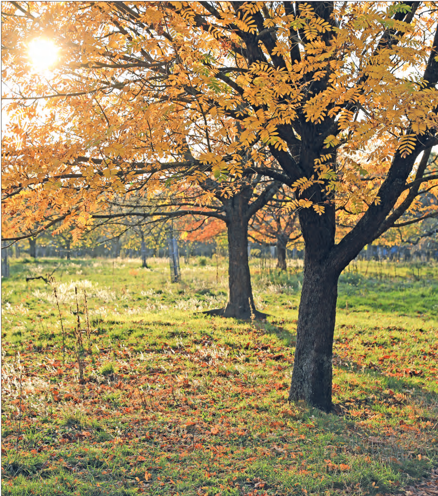
Die Aktion „Pflanzt Hochstamm-Obstbäume“ trägt dazu bei, den bedrohten Lebensraum „Streuobstwiese“ zu erhalten.