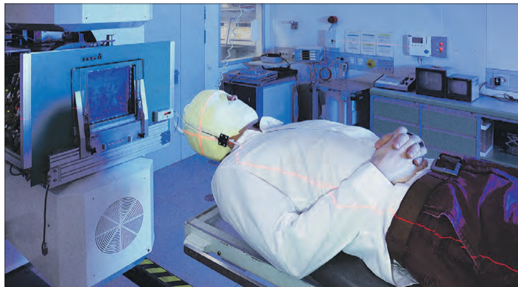
BEHANDLUNGSPLATZ BEI GSI UND FAIR.

DARMSTADT – GSI/FAIR engagiert sich bei der Benefiz-Radveranstaltung „Tour der Hoffnung“ zugunsten krebs- und leukämiekranker Kinder. Wenn die bundesweit bekannte Spendenaktion am 12. August 2022 um 15 Uhr am Bürgermeister-Pohl-Haus in Wixhausen Station macht, werden Vertreter*innen von GSI/FAIR und des Vereins zur Förderung der Tumorthherapie mit schweren Ionen e.V. dabei sein. Sie informieren über die Krebstherapie mit Ionen und den aktuellen Stand der Forschung, sowie über die Aktivitäten des Fördervereins.