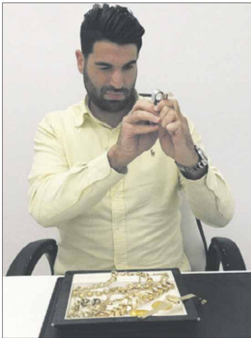
Ihr Spezialist für Goldankauf.