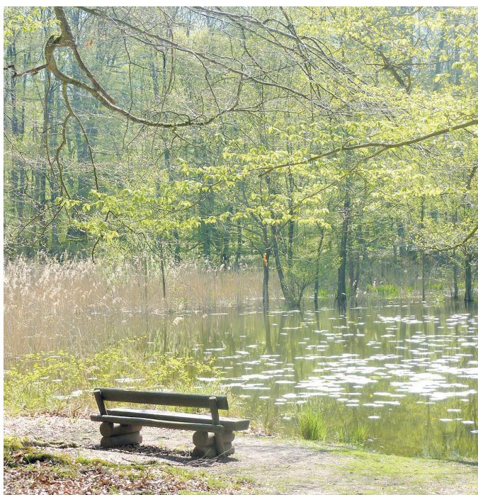
(Abb. 2) Ernst-Ludwig-Teich

Nehmen Sie dann den Weg rechts zur Hanauer-Stein-Schneise. Der Name weist auf die erwähnten Grafen und der solide Unterbau auf eine Fernverbindung hin. Biegen Sie dann links in die Speyerhügelschneise zum Talgrund der Heegbachaue ein. Der erste Waldweg rechts führt Sie zum Ernst-Ludwig-Teich. Dieser ist wegen seiner idyllischen Lage mitten im Wald ein viel besuchter Ort im Messeler Park. Der Teich wurde 1890 angelegt, als man anfangs Wälder auch zu Erholungsgebieten umzugestaltete. Außerdem lieferte er als Fischteich erstmals kolossale Karpfen und Hechte, wie alte Erzhäuser zu berichten wussten. Heute ist er durch Wasserpflanzen und den breiten Schilfgürtel von Verlandung bedroht. Er trägt den Namen des jagdversessenen Landgrafen Ernst-Ludwig (1678-1739). Um dessen unruhliche Vergangenheit als absolutistischer Fürst hat man sich bei der Namensgebung seinerzeit wohl wenig Gedanken gemacht. Folgen Sie dem etwas holprigen Weg vom Teich bis zum ebenfalls viel befahrenen Dammweg. Dort rechts weiter zur nahen Heegbachaue. Am Waldrand steht die Lütkekmann Hütte, benannt nach einem verdienten Leiter des Langener Forstamtes.