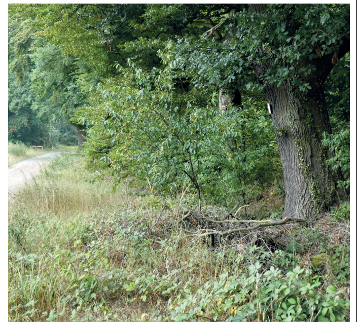
(Abb. 12) Der Graben des Ärgers der Arheilger Bauern

Kurzum: Die Arheilger Bauern wollten kein Wild auf ihren Feldern und der Landgraf ihnen keinen Zaun spendieren. So kam es, dass den Arheilgern ein Schutzzaun vor dem Wald verweigert, ihnen aber huldvoll genehmigt wurde, in mühevoller Schuferei selbst einen tiefen Graben als Schutz gegen das Wild ausheben zu dürfen. So war das damals. Gehen Sie nicht achtlos an diesem weithin unbekanntem und unscheinbarem Ort großen Ärgers vorbei.