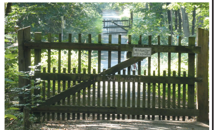
(Abb. 5) Wildgatter im Park

Über die Kalkofenschneise kommen Sie direkt zum ehemaligen Forsthaus Kalkofen mit einem vielbesuchten Gartenlokal. Oder Sie wandeln weiter auf landgräflicher Jagdherrlichkeit. Dazu biegen Sie in die Teichschneise ein und folgen dieser bis zur Kranichsteiner Straße. Dort und an weiteren Waldzugängen gibt es noch die altertümlichen Falltore des einstmaligen großen Wildparks, der bis nach dem letzten Weltkrieg bestand. Heute sind nur noch kleinere Bereiche im Kranichsteiner Wald eingezäunt. Durch die besondere Aufhängung fallen die Latentore von selbst zu und die Durchgänge sind für das Wild geschlossen. Von den Falltoren aus landgräflicher Zeit sind keine erhalten. Hüter der Falltore waren einstmalig die Förster der Falltorhäuser.