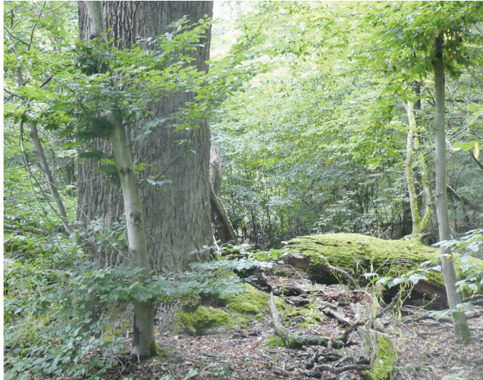
(Abb. 7) Baumveteran an Unterer Stockschlagschneise

Biegen Sie nach Querung der Silzwiesen in den Unteren Stockschlagweg ein, der mit etlichen weiteren Erinnerungen an landgräfliche Jagdherrlichkeit aufwartet. Nein – Stockschläge wurden an unartige Kinder hier nicht verabreicht. Als Stockausschläge oder kurz Stockschläge bezeichnet man bei Bäumen Triebe, die aus dem Stumpf, auch Stock genannt, wieder austreiben – eine frühe Form der Waldbewirtschaftung. Der gesamte Stockschlagweg ist eine Allee uralter Baumveteranen – lebender und abgestorbener. Es lohnt sich, Blicke nach links und rechts in den Wald und nach oben in die Kronen zu werfen. Bereichern Sie ihre Eindrücke mit einem kurzen Abstecher in die Schneise nach Osten und zurück, wo sich uralte Eichen nur so häufen. Der Erhalt eines Netzes von sogenannten Habitat Bäumen (Tot- und Altholz sowie Nistbäume) sind Beiträge zur Steigerung der Artenvielfalt moderner Forstwirtschaft.