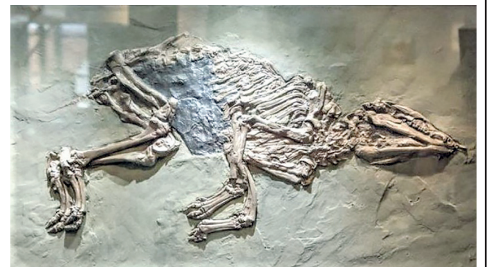
Abb. 2: Das weltberühmte Urpferdchen lebte vor etwa 48 Millionen Jahren.