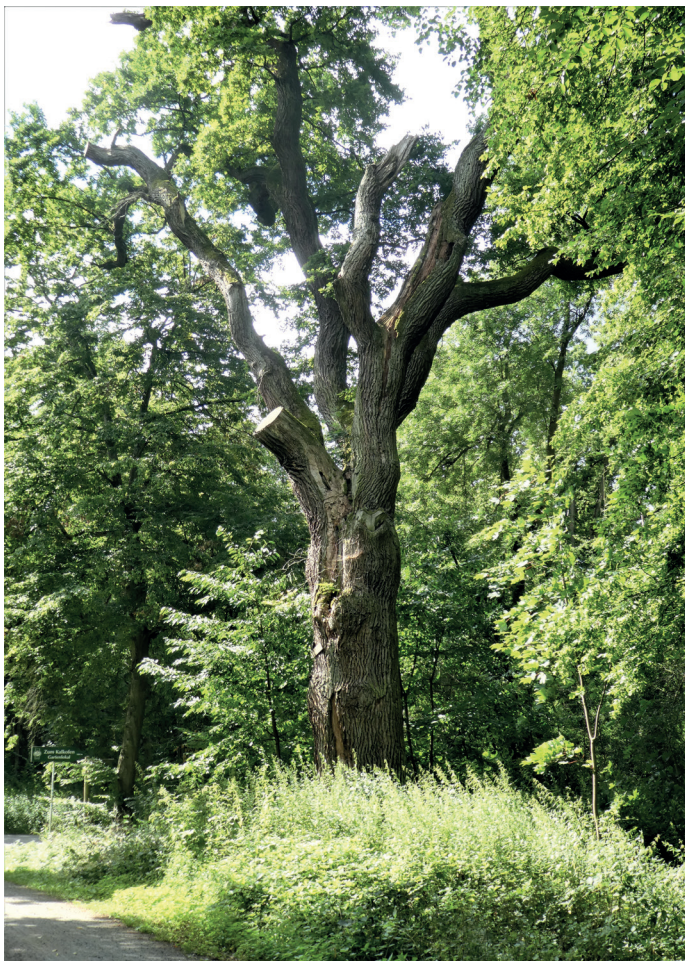
(Abb. 10) Die Dragonereiche

An der Kreuzung zur Kalkofenschneise steht ein weiterer Eichen-Veteran, die Dragonereiche. Sie erinnert an die Hessen-Darmstädtischen-Leibdragoner, die hier unter Ludwig VIII. ein Lager hatten. Auch das ehemalige Forsthaus Kalkofen, heute ein Gartenlokal, war für Ludwig aus ganz anderen Gründen einstmals von Interesse. Hier gab es nämlich einträgliche Kalk- und Lehmvorkommen, aus denen das Material für Kalköfen und Ziegeleien gefördert wurde.