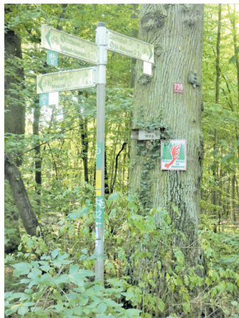
(Abb. 1) Beginn des Stellwegs gegenüber Forsthaus Bayerseich

Gleich am Anfang des Stellwegs weisen Sie etliche Wegweiser auf die gute Erschließung des Waldes für Besucher hin. Die alte Eiche dahinter erinnert an die großen Eichenbestände, die es einst in dem Buchen-Eichen Mischwald gab. Bei dieser Tour werden Ihnen noch etliche Eichen-Veteranen auffallen. Ein Spaß für Kinder: Sucht am Wegrand nach dem dicksten Baum, der Euch begegnet! Ein Rollmeter aus Mutters Nähkasten hilft beim Vermessen jeweils in einem Meter Höhe. Beachtet aber, dass man in Naturschutzgebieten die Wege nicht verlassen darf. Der Messeler Park ist nicht nur ein Ort der biologischen Vielfalt, sondern auch ein Ort mit vielen Erinnerungen an die höfische Darmstädter Waldvergangenheit, als feudales Jagdvergnügen mit Frust und Fron der Bauern im Umland einherging. Bereits der Stellweg erinnert daran. In der Blütezeit der höfischen Jagdkultur im 18. Jh. war das sogenannte eingestellte Jagen der Höhepunkt einer prunkvollen Inszenierung. Dazu wurde das Wild von einer Unzahl Bauern aus dem weiträumigen Waldrevier auf einen engen Raum zusammengetrieben, d.h. eingestellt, und dann von Seilen an denen Lappen hingen „am durch die Lappen gehen“ gehindert. Bequem konnte die Jagdgesellschaft von einem Jagdwagen aus das Wild erlegen.