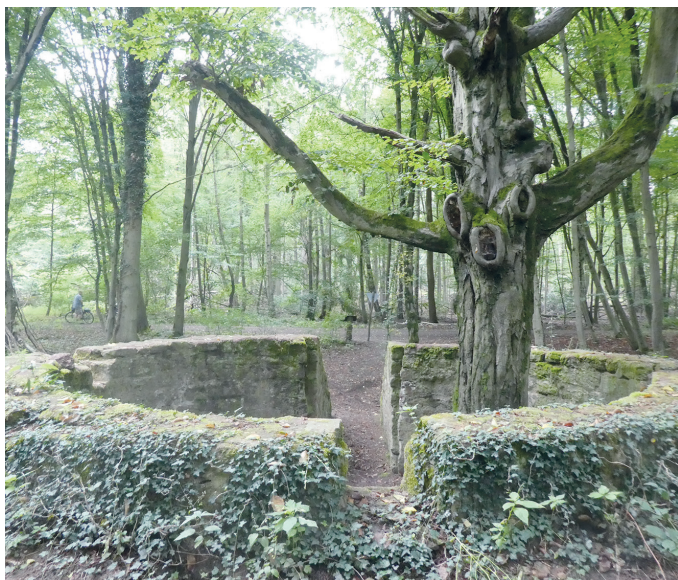
(Abb. 8) Charlottenplatz an unterer Stockschlagschneise

Nicht genug mit Brunnen, Bäumen und Teichen landgräflicher Herrlichkeit. Am Weg steht links im Wald ein schanzenartiger Jagdschirm, in dessen Mitte inzwischen ein Baum wächst. Durch die Schießscharten konnten die Jäger auf Tiere schießen, ohne selbst angegriffen oder bemerkt zu werden. Erbaut hat diesen und andere gemauerte Schirme Landgraf Ludwig VIII. Charlottenplatz heißt der Ort, benannt nach seiner Schwester Henriette-Charlotte. Sie war angeblich nicht nur jagdbesessen wie ihr Vater und ihr Bruder, sondern auch verschwendungssüchtig und zudem wenig glücklich mit einem nicht grade reichen Kasseler Prinzen verheiratet. Sie hielt sich lieber am prunkvollen, aber hoch verschuldeten Darmstädter Hof auf als bei ihrem Gatten.