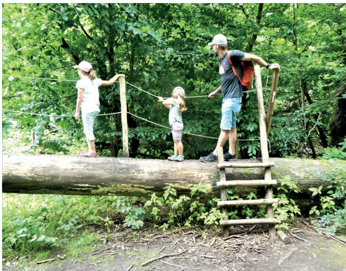
(Abb. 11) Der Fabienne Steig bei der Dianaburg

Im September 2018 zog das Sturmtief Fabienne quer durch Deutschland und richtete besonders im Rhein-Main Gebiet riesige Schäden an. Umgeworfene Bäume blockierten Landstraßen und Orte wie Mörfelden. Im Kranichsteiner Wald wurden in wenigen Minuten Jahrhunderte alte Bäume entwurzelt oder wie Streichhölzer umgeknickt. Auf 800 Meter hat das Bioeverum in Kranichstein diesen Steig geplant, um die Dramatik der mit dem Klimawandel einhergehenden Waldschäden erlebbar zu machen. An Seilen als Orientierungshilfen geht es auf und über umgefallene Baumriesen und an mannshoch aufragenden Wurzelteilern vorbei. Der Weg führt durch eine zerstörte Welt, deren Eindringlichkeit im Kopf Spuren von Nachdenklichkeit und Zukunftsbesorgnis hinterlässt. Aber die in dieser Apokalypse aufkommenden Jungpflanzen, die Pilze und Moose auf vermoderndem Holz sind auch Anzeiger für die Selbsthilfekräfte der Natur, die einen sich selbst überlassenen Wald hervorbringen werden – der nichts mit dem gemein haben wird, den wir immer noch, und ganz besonders im Messeler Park, bestaunen können. Sieben Stationen informieren Sie auf dem Steig. Festes Schuhwerk sollte man anhaben. Für Kinder ist der Steig ein ganz besonderes Erlebnis und allein schon einen Besuch wert. Beim alten Forsthaus Kalkofen finden Sie Parkmöglichkeiten.