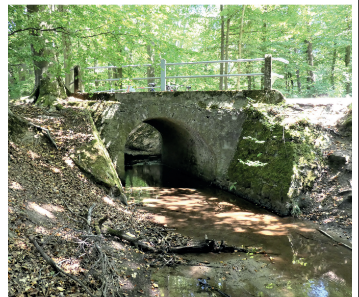
(Abb. 13) Der Hahnwiesenbach im Mörsbacher Grund

Der Mörsbacher Grund gehört zu dem Natura 2000-Gebiet mit den Naturschutzgebieten Heegbachaue, Mörsbacher Grund, Silzwiesen und dem Wildschutzgebiet Kranichstein. Das Mosaik aus Wiesen, Wäldern, kleinen Bächen und einigen Teichen macht daraus ein Rückzugsgebiet für viele geschützte Arten und darüber hinaus ein Schutzgebiet von europäischem Rang.