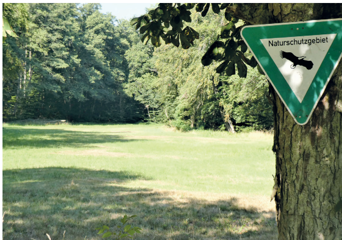
(Abb. 3) Naturschutzgebiet obere Heegbachaue am Dammweg

Die Heegbachaue ist ein Naturschutzgebiet, das die Feuchtwiesen und Altholzbestände beiderseits von Heegbach und Rutschbach zwischen Messel und Egelsbach umfasst. Viele begleitende Wiesenflächen liegen heute brach und werden von Folgestadien besiedelt. Geschützte Wald-Wiesen-Bereiche umfassen weiterhin den Mörsbacher Grund und die Silzwiesen. Für Fremde sind die vielen Namen des Heegbachs sicherlich verwirrend. Östlich der Lütkekmann Hütte mündet in den Bach der Zufluss der Offenthaler Kläranlage. Ab hier heißt er kartografisch korrekt Hegbach östlich davon Rutschbach. Das hält aber die Egelsbacher nicht davon ab, den ganzen Bach Rutschbach zu nennen und die Erzhäuser hält es nicht davon ab, das „e“ genüsslich zu dehnen und den Bach zu verweiblichen, weshalb er im Dorfmund „die Heebach“ und hochgedeutet Heegbach heißt. Und wenn die Egelsbacher vom Mühlbach sprechen, dann ist damit das gleiche Gewässer gemeint, zumindest westlich der Dreischläger Allee. Dort stand bis 1857 am Rand einer Wiese die einzige Mühle am gesamten Bachlauf.