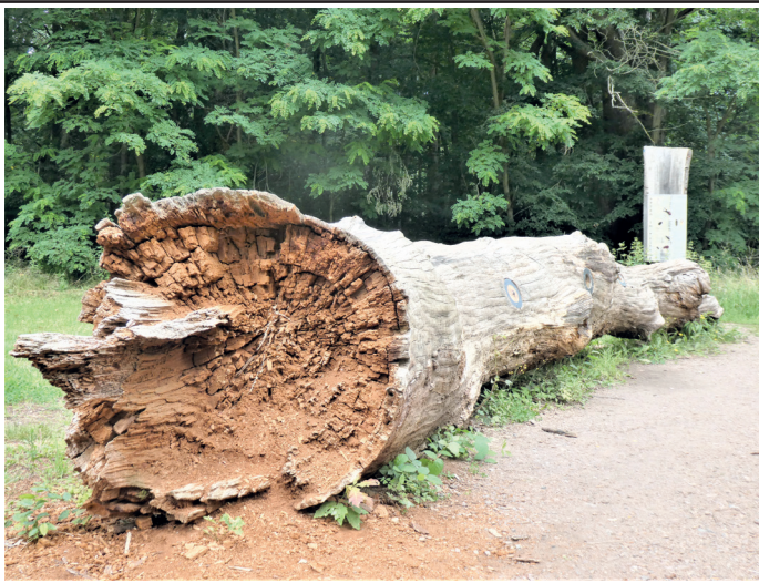
(Abb. 9b) Die Totholzeiche an der Dianaburg