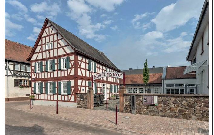
Abb. 1: Der Museumshof in der Langgasse.