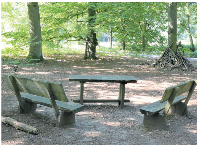
(Abb. 4) Sitzgruppe am Bornweg, Abzweigung nach Messel

Am etwas ansteigenden Weg zur Bornschneise stehen viele alte Eichen. An der Kreuzung mit der Langen Schneise können Sie in diese einbiegen zu einem Besuch von Messel mit seinen Fachwerkhäusern und dem sehenswerten Heimat- und Fossilienmuseum. Südlich des Mörsbacher Grundes steht am Weg eine einladende Sitzgruppe. Von hier können Sie einen kleinen Abstecher zu dem nahen Zinkenteich machen. Es ist ein „Himmelsgewässer“ ohne eigenen Zufluss und es wird nur vom Grundwasser und dem Himmel gespeist. Gegenüber, mitten auf der Zinkenwiese, und daher leider nicht zugänglich, steht einer der vielen Namensbäume im Wald. Die „Huteeiche“ ist die letzte Eiche eines ehemaligen Hutewaldes. Hutewälder wurden früher gerne als Waldweiden genutzt anstelle der aufwändig zu pflegenden Mähwiesen. Diese Eiche hat einen Umfang von sechseinhalb Metern. Auf der Webseite des Forstamts Darmstadt finden Sie alle Namensbäume des Forstamtsbezirks östlich von Darmstadt. In die Wälder des Messeler Parks trieben früher auch die Erzhäuser Bauern ihr Vieh. Daran erinnert der am Nordrand des Mörsbacher Grundes verlaufende Erzhäuser Weg (s. Karte).