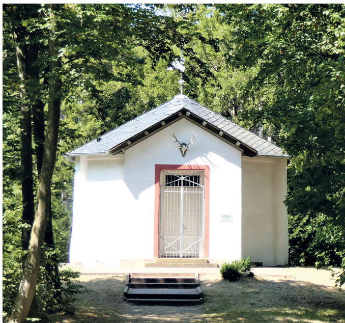
(Abb. 9a) Dianaburg

Für naturhistorisch Interessierte gibt es hier viel zu entdecken. An der Dianaburg und im Wald gegenüber stehen seltene aus Stocktrieben entstandene hohe Kiefern, darunter Sechslinge, von denen allerdings nicht mehr alle Stämme erhalten sind. Außerdem ist eine Totholzeiche zu bestaunen, in deren Stamm Guckfenster eingelassen sind mit Insekten, die u.a. hier ihren Lebensraum haben (Abb. 9b).