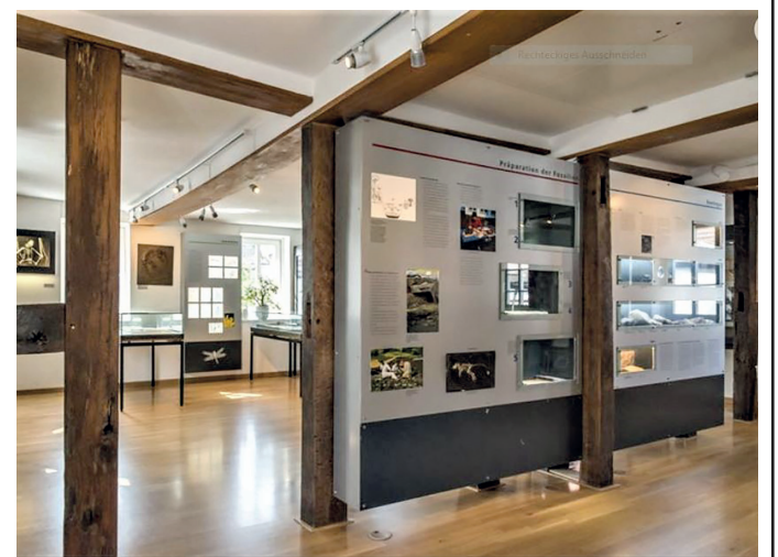
Abb. 4: Innenansicht des Museums.