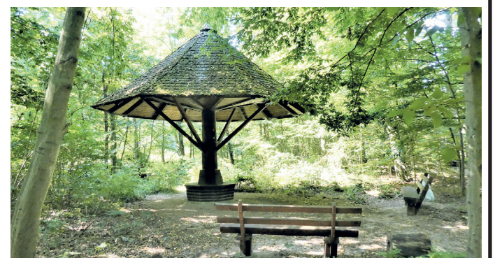
(Abb. 6) Tempel an Georgenbrunnen und Arheilger Viehtrift