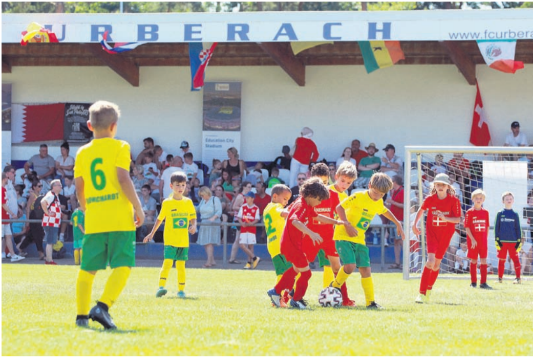
Der Nachwuchs von Gastgeber Viktoria war mit drei Mannschaften (Frankreich, Brasilien, Kroatien) bei der Mini-WM vertreten. Die Brasilianer (Bild) wurden 15., die Franzosen landeten auf einem starken 6. Platz.

Gleich mit drei Mannschaften waren die Gastgeber von der Viktoria bei der WM vertreten. Sie vertraten Frankreich, Brasilien und Kroatien. Die