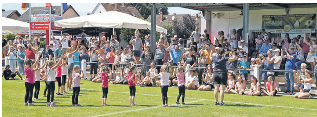
Am Sonntagnachmittag präsentierten sich die Abteilungen beim „Bunten Rasen“.