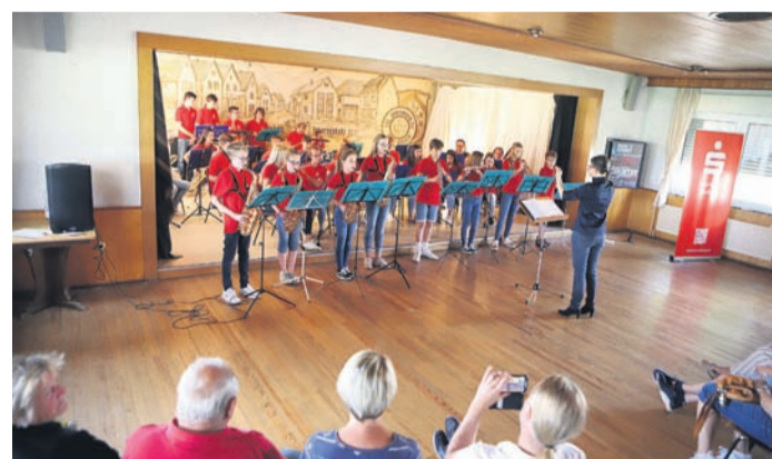
Das Vororchester und das Jugendblasorchester spielten einige Stücke gemeinsam.

Nach Stationen unter anderem in der Kulturhalle, bei der Turngemeinde oder auch einmal in der Bürgerhalle in Eppertshausen fand die 2022er Auflage im Clubhaus der Germania statt, wo bereits in den neunziger Jahren einige Ausgaben des Nachwuchskonzertes über die Bühne gegangen waren. Neben dem Beginner, dem Vororchester und dem Jugendblasorchester zeigten auch die Blockflötenkinder ihr Können. Die jungen Musikerinnen und Musiker hatten sich unter anderem bei einem Probenwochenende auf die Veranstaltung vorbereitet. Die