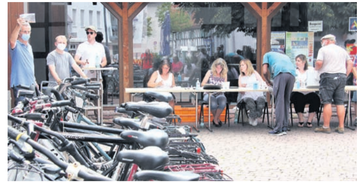
64 Fahrräder waren im Angebot. Bis auf 13 gingen alle weg.

Rödermark (NHR) Zum Ersten, zum Zweiten und zum Dritten! Verkauft! 5 Euro waren das Mindestgebot, bis auf 155 Euro hatten sich die Bieter hochgetrieben, doch das war immer noch ein echtes Schnäppchen für ein hochwertiges Mountain-Bike, das – nach seinem Aussehen zu urteilen – kaum gefahren worden war. Was sich im Fundbüro seit der letzten Auktion 2018 angesammelt hatte und nicht abgeholt worden war, das wurde am Donnerstag vor der Kelterscheune versteigert. Rund 100 Positionen umfasste die Liste. Mit flotten Sprüchen machte Thomas Goniwiecha vom Bürgerbüro aus der Auktion ein Event mit großem Unterhaltungswert. So sicherte er der Stadtkasse den einen oder anderen Zusatz Euro, verkaufte sogar ein Brillenetui, einen