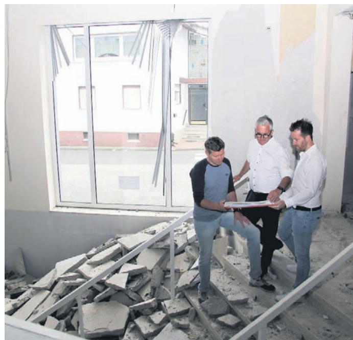
Das Schwarzkopf-Areal in Rödermark wird neu bebaut.