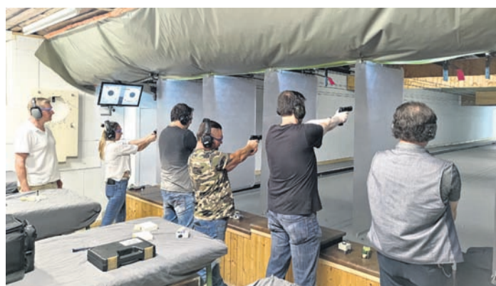
Mitglieder am mittlerweile dauerhaft stark frequentierten Schießstand.