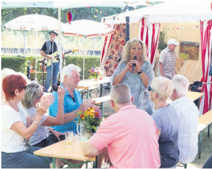
„CaRo“ (unser Bild) war am Samstag gemeinsam mit der Gruppe „Jam Box Frankfurt“ für die Live-Musik zuständig.