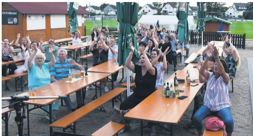
Die 60 Gäste beim „Rudel SingSang“ waren weniger als vom MGV Münster erhofft. Die, die gekommen waren, hatten aber sichtlich Spaß.

Volksradfahren: Die Teilnahmegebühr (ohne Medaille) wird für Mitglieder des AGV vom Verein übernommen (Infos Seite 7).