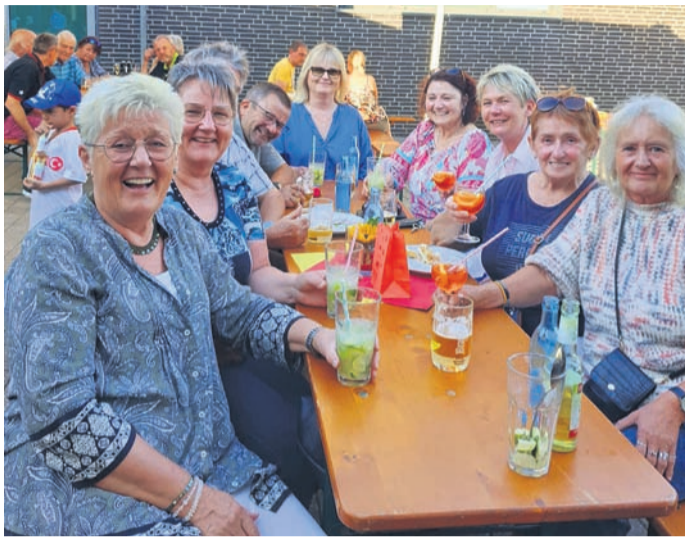
Der TTC feierte sein vereinsinternes Sommernachtsfest und ehrte Vorstandsmitglieder.

TTC Eppertshausen feiert Sommernachtsfest