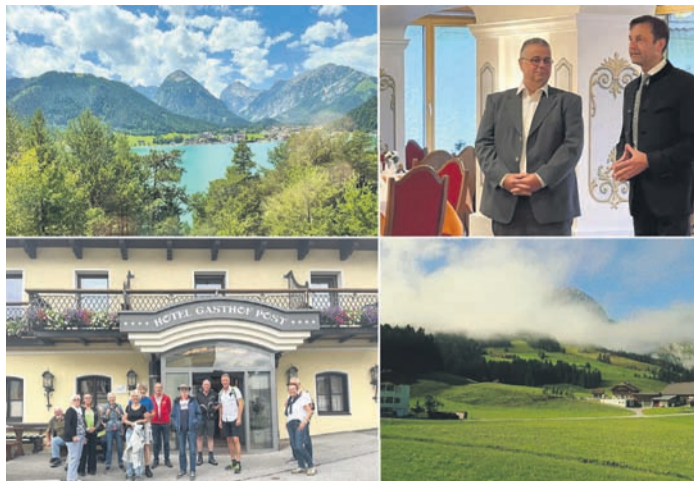
Das Wochenende in Abtenau anlässlich der 50-jährigen Städtepartnerschaft war voller Erlebnisse und herzlicher Begegnungen.