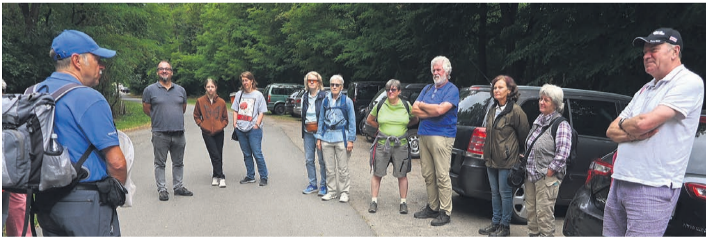
Berührung am Don Bosco-Heim.

kleinen, aber feinen Format klassische Musik einem ganz neuen Publikum erschließen. Bei der „Oper im Espresso-Format“ kann man in entspannter Atmosphäre klassische Musik authentisch und hautnah fast „vor der Haustür“, oder wie hier am Strand, erleben.