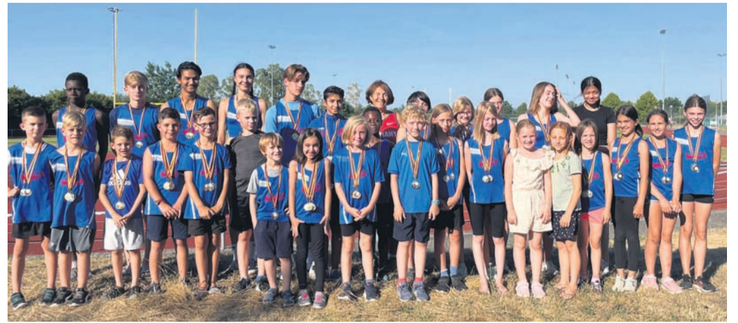
Die erfolgreichen jungen Leichtathleten freuen sich über ihre Erfolgserlebnisse.

che Gemeinschaftsspiele. Das alles brachte gute Laune bei ausgelassener Stimmung und heizte die Vorfreude auf das nächste Camp im kommenden Jahr mächtig an. Sehr bemerkenswert ist nach wie vor, dass das komplette Trainerteam aus vereinsinternen Trainern und ehemaligen Teilnehmern besteht.