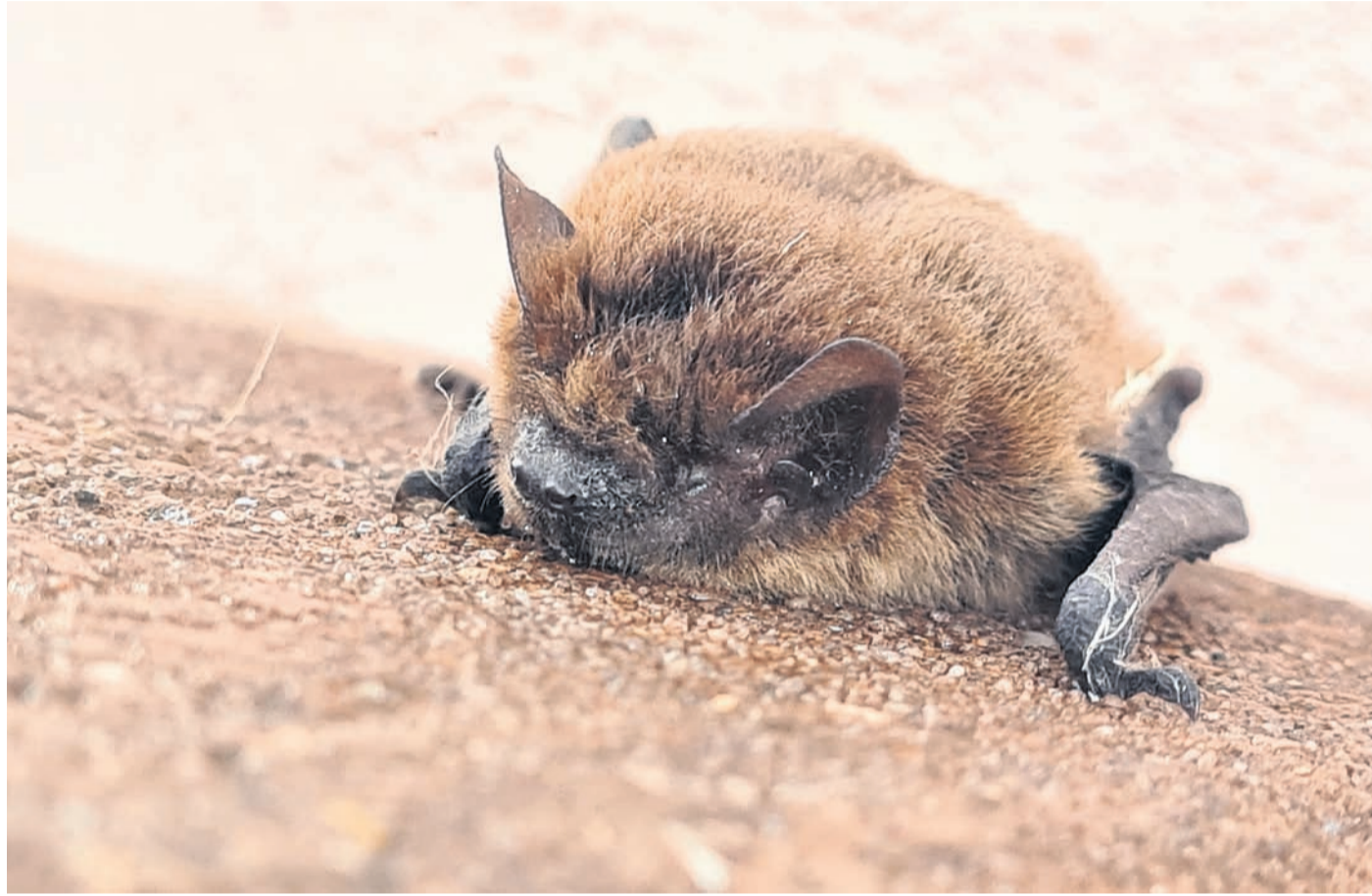
Die Zwergfledermaus lässt sich normalerweise nicht am Tage blicken. Dieses Weibchen ist allerdings so geschwächt, dass es sich auf einer kleinen Steinmauer niedergelassen hatte.