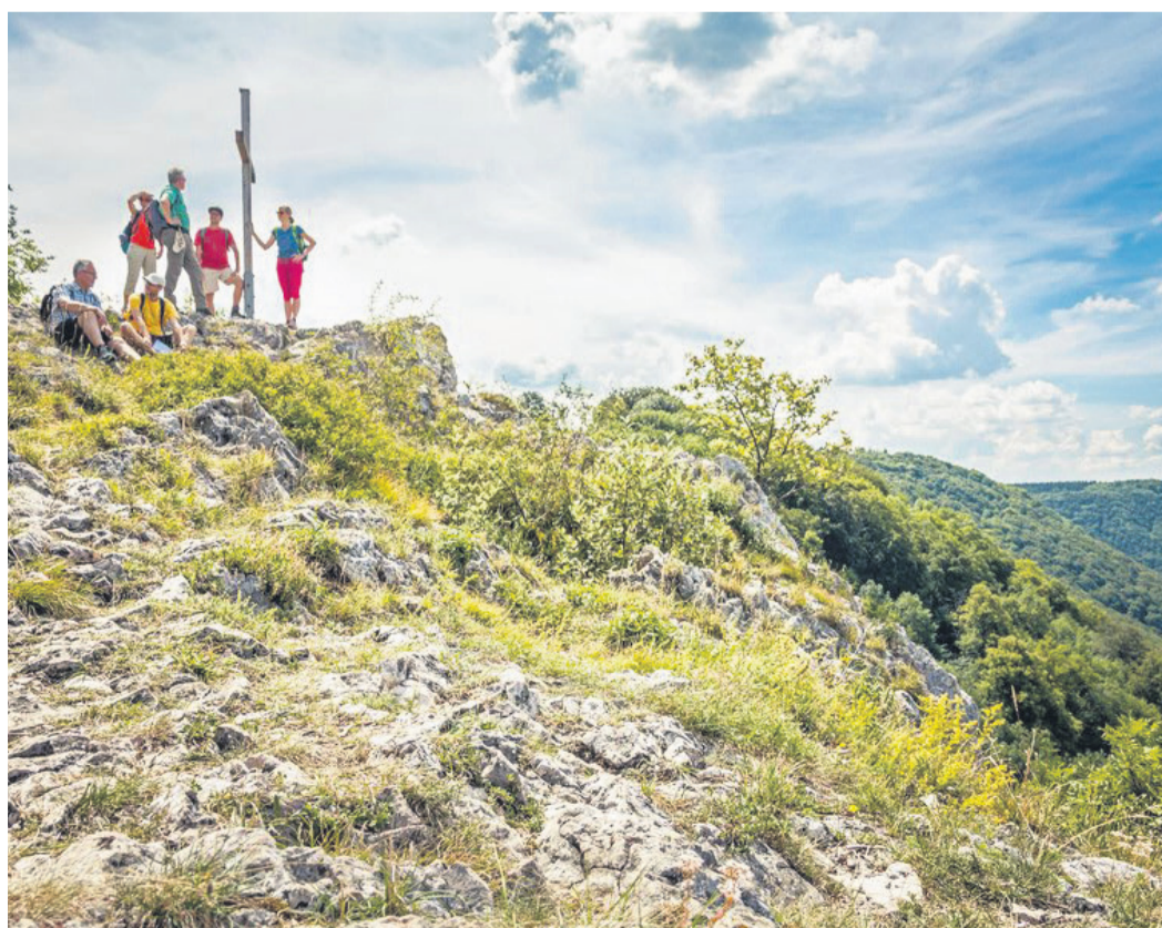
Auf der Wanderung zum Aussichtspunkt Roßfels am Albtrauf werden Ausflügler mit bester Fernsicht belohnt.

Zur Belohnung locken eine schwer zu übertreffende Fernsicht und eine Einkehr im Wanderheim Roßberghaus.