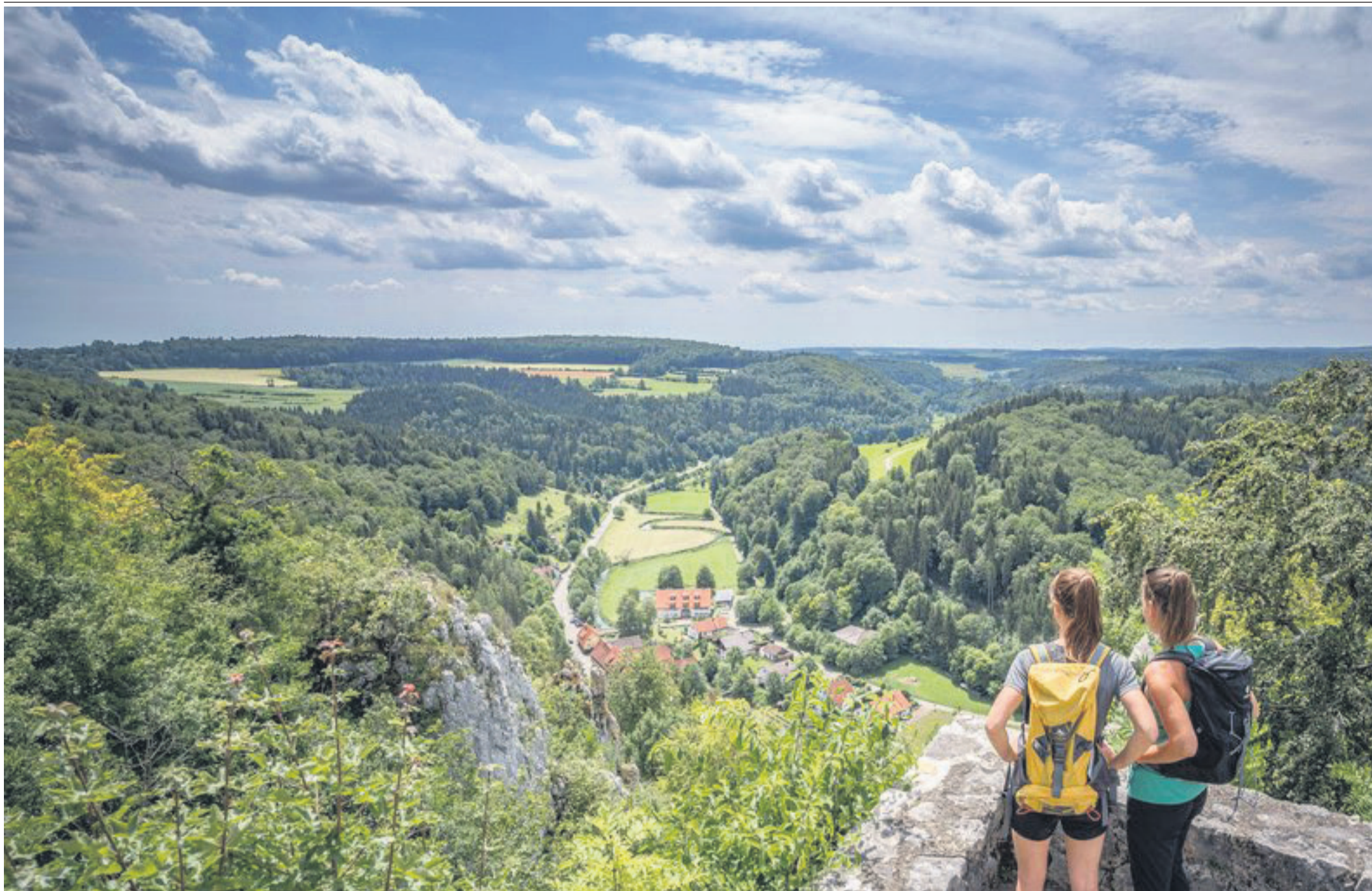
Im Unesco-Biosphärenreservat Schwäbische Alb finden Wanderer zahlreiche Aussichtspunkte, hier im Bild die Aussicht ins Lautertal von der Burg Hohengundelfingen.