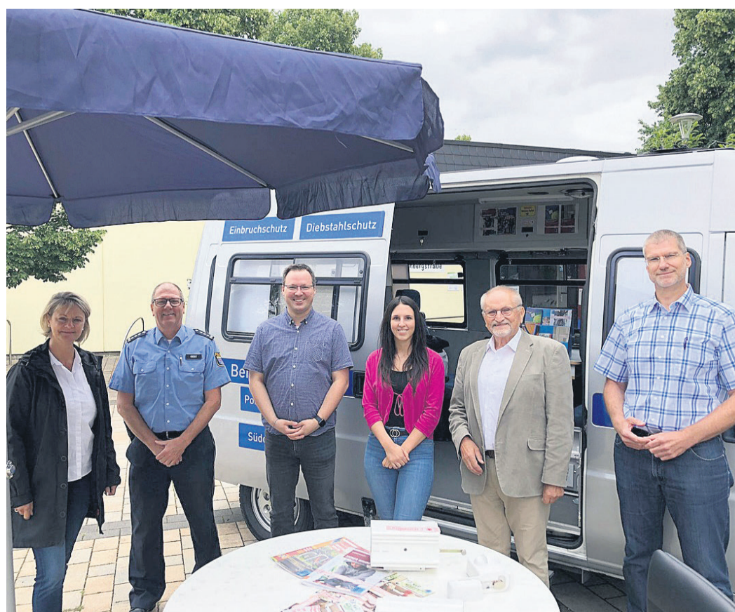
Die Experten der Polizei beraten zum Thema „Einbruchschutz“.

Zwischen 10 und 14 Uhr informieren die Beamten der Bera-