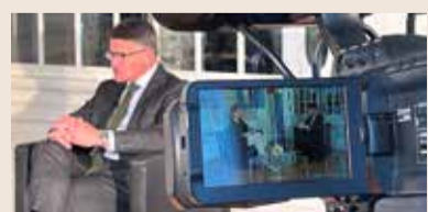
Boris Rhein, Ministerpräsident Hessen, im Interview mit rheinmaintv

Hessen verfolgt und wie er sich die Wahl zum Ministerpräsidenten im nächsten Jahr sichern will. Boris Rhein ist der „Neue“ an Hessens Spitze. Der in Frankfurt geborene CDU-Politiker ist seit dem 31. Mai 2022 hessischer Ministerpräsident. Allerdings kein Neuling im Hessischen Landtag, war er doch zuvor - seit 2019 Präsident - desselbigen. Die Landespolitik ist ihm vertraut, bereits 1999 wurde er Mitglied des Landtags. Es folgten Stationen als Staatssekretär im Hessischen Ministerium des Innern und für Sport, als Minister des Inneren und für Sport und als Minister für Wissenschaft und Kunst. Boris Rhein lebt mit seiner Frau und den beiden Söhnen in Frankfurt, wo er 2012 die Stichwahl zur Oberbürgermeisterwahl gegen Peter Feldmann verlor.