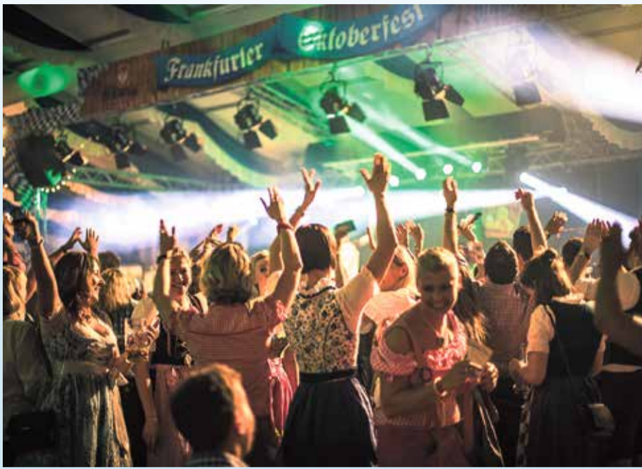
Ausgelassene und fröhliche Stimmung wird wieder beim Frankfurter Oktoberfest erwartet.