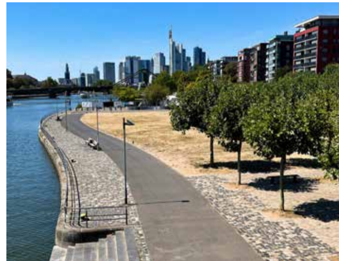
Ausblick auf den über zwei Hektar großen Park in der Weseler Werft.

sonders beeindruckend sind die 26 Zitate von Opfern und Zeitzeugen, die auf den Wegen, im Keller und am Stellwerk eingraviert sind. Sie geben den Opfern eine Stimme und veranschaulichen gleichzeitig den Terror, der von den Tätern ausging. Führungen durch die Erinnerungsstätte bietet das Jüdische Museum Frankfurt an.