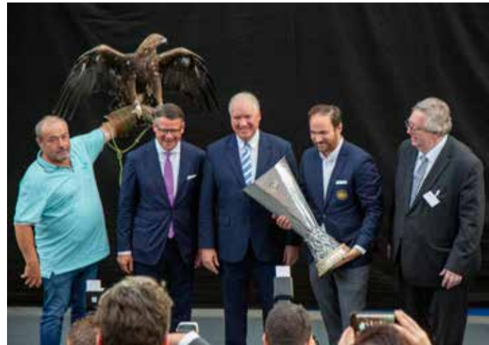
Eine Fotogalerie der Veranstaltung finden Sie auf www.der-frankfurter.de .

Branchen auszuschließen, wie das in Frankfurt mit den Digitalisierungszentren, geschehe, sollte deren Ansiedlung gefördert werden. „Wir könnten uns mit dem weltweit größten Internetknoten und unserer Datenzentrenkapazität zur europäischen Digitalisierungshauptstadt entwickeln, wenn man es zuließe, statt es zu behindern.“ Caspar rief ebenfalls dazu auf, durch mehr Innovationsoffenheit und Ausweisung von Bauland für Wohnen, Gewerbe und Industrie den Unternehmen auch eine gute Perspektive für die Zukunft zu geben. Hierbei verwies er auf Formen der Energiegewinnung oder auch der Lebensmittelproduktion, die zukünftig eine beeindruckende Perspektive bieten würde. Der Hessische Ministerpräsident Boris Rhein hob in seiner Rede die Bedeutung des Rhein-Main-Gebiets als eine der wirtschaftsstärksten Regionen Deutschlands hervor. „Mehr als ein Viertel des Bruttoinlandsproduktes Hessens