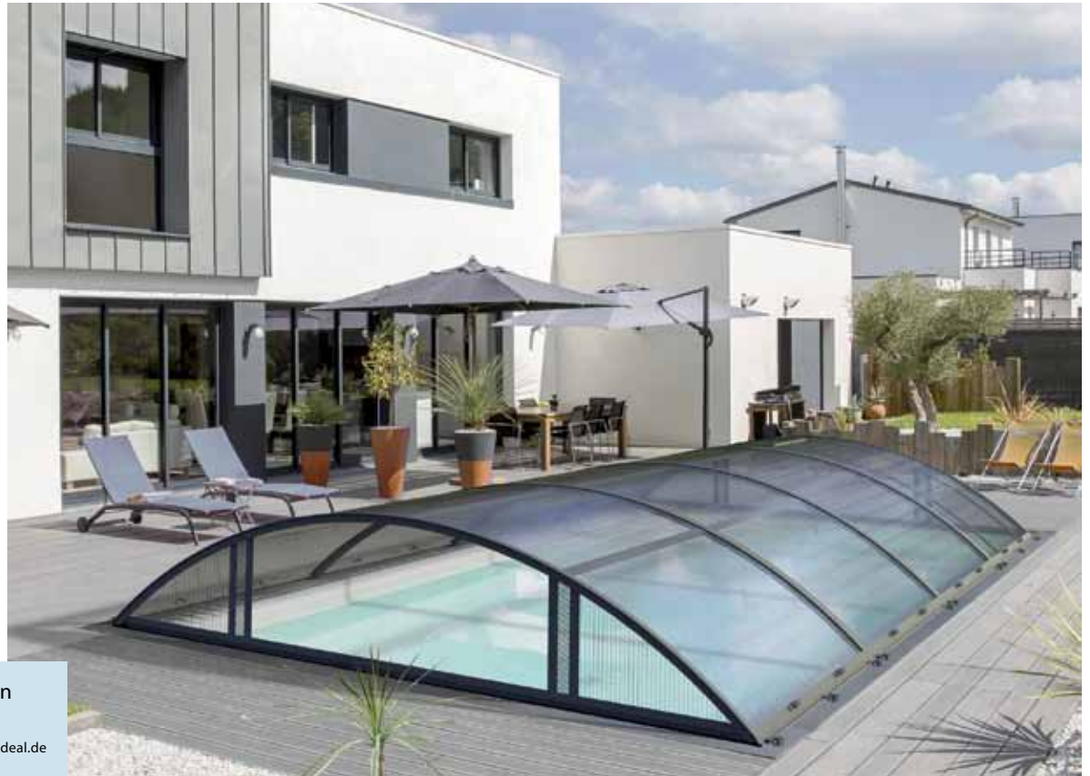
Schwimmbadüberdachungen können den Pool auch optisch aufwerten.

(DJD-K). Wer sich für einen Pool im eigenen Garten entscheidet oder sein Schwimmbecken sanieren möchte, sollte eine Überdachung mit einplanen. Hier sind vier Gründe, die dafürsprechen: 1. Mit einer Poolüberdachung spielen sommerliche Wetterkapriolen keine Rolle, zudem lässt sich die Saison merklich verlängern. 2. Wer den Pool vor Verunreinigungen bewahrt, hat weniger Pflegeaufwand. 3. Ein Auskühlen des Wassers wird verhindert und wirkt sich positiv auf den Energieverbrauch im Poolbetrieb aus. 4. Abschließbare Abdeckungen sorgen für Sicherheit, vor allem für Kinder. Informationen zu verschiedenen Überdachungslösungen gibt es etwa unter www.abrideal.de . Nach einem kostenlosen Beratungsgespräch vor Ort wird das ausgewählte System durch Monteure geliefert und aufgebaut.