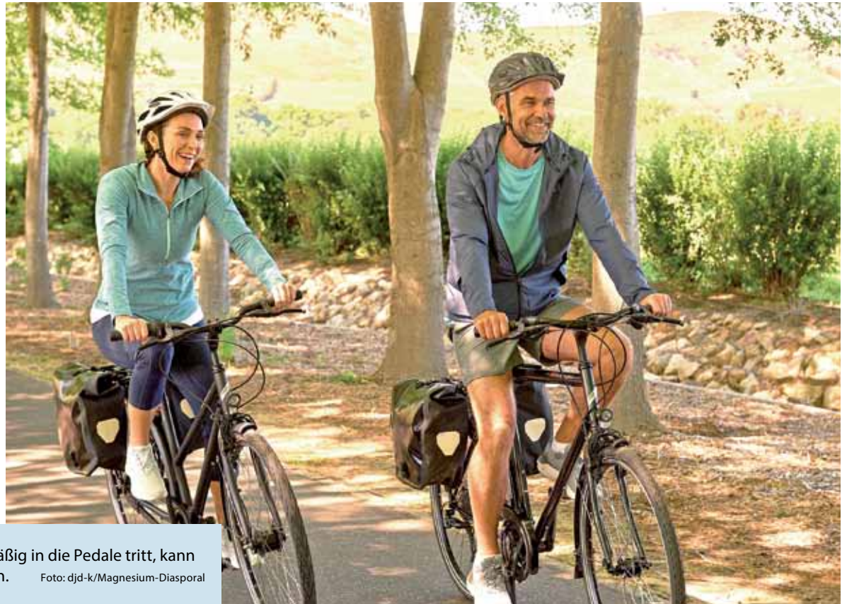
Auf die Räder, fertig, los. Wer regelmäßig in die Pedale tritt, kann dem Stress buchstäblich davonradeln.

(DJD-K). Gesundheitsexperten betonen immer wieder, wie wichtig Bewegung für den Körper und die Widerstandskraft ist. Allerdings ist es ratsam, eine Sportart zu wählen, die Spaß macht – wie Radfahren. Viele Männer und Frauen fühlen sich dabei wohl. Denn der Outdoorsport geht mit einem hohen Erlebniswert einher und fördert die Entspannung. Nach Erfahrung der Sportmedizinerin Stefanie Mollnhauer wirkt er zudem positiv auf den Hormonstatus und fördert so zusätzlich das Wohlergehen. Damit die Muskeln unterwegs locker bleiben, empfiehlt die Expertin Radfahrern, auf eine ausreichende Flüssigkeitszufuhr zu achten und an die Einnahme von Mineralstoffen wie Magnesium zu denken. Unter www.diasporal.de gibt es Tipps, warum das Powermineral gerade für aktive Sportler so wichtig ist.