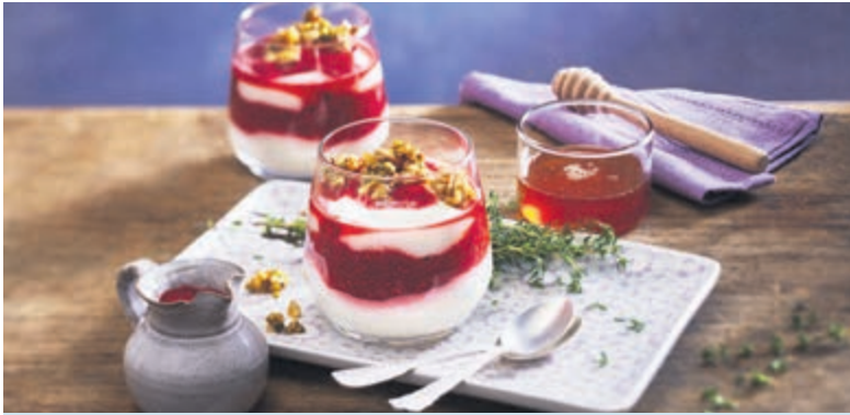
Für besondere Genussmomente: Thymianhonig macht etwa eine Joghurtmousse zum vielschichtigen Geschmackserlebnis.