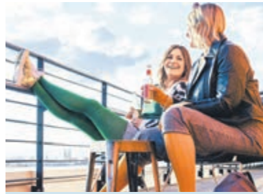
Wer die Beine immer wieder hochlegt, entlastet die Venen.

(DJD-K). Lange Tage und viele Sonnenstunden: Das Leben spielt sich wieder draußen ab. Entspannte Spaziergänge, eine flotte Runde Nordic Walking, Gartenarbeit oder ein Stadtbummel sind jetzt beliebte Aktivitäten. Viele Menschen fühlen sich an der frischen Luft motivierter und energiegeladener – aber oft spielen die Beine nicht mit. Sie fühlen sich müde und schwer an, sind geschwollen oder es zeigen sich Krampfadern. Dann können medizinische Kompressionsstrümpfe nützlich sein. Sie helfen bei Venenleiden, unterstützen die Venentätigkeit und können Thrombosen vorbeugen. Sie bringen den Blutrückfluss aus den Beinen zum Herzen in Schwung. Spannungseffekte und Schmerzen klingen ab, die Beine fühlen sich vitaler und leichter an. So kehrt Energie für zahlreiche Aktivitäten zurück, die unbeschwerter viel mehr Spaß machen.