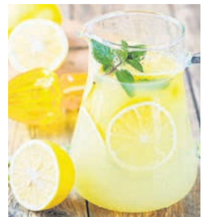
Selbst gemachte Zitronenlimonade bekommt mit Honig nicht nur die richtige Süße, sondern auch ein besonderes Aroma.

Häufig bieten Imkereien ihre Honige an der eigenen Haustür an, was ein Beleg für die lokale Ernte und für die geleistete Bestäubungsarbeit unserer Bienen vor Ort ist. Unter www.honigmarkt.info gibt es eine Karte mit vielen heimischen Imkereien.