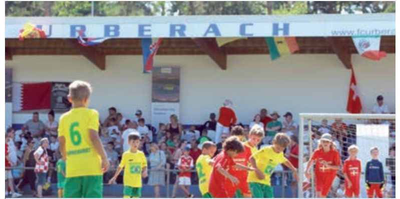
Der Nachwuchs von Gastgeber Viktoria war mit drei Mannschaften (Frankreich, Brasilien, Kroatien) bei der Mini-WM vertreten. Die Brasilianer (Bild) wurden 15., die Franzosen landeten auf einem starken 6. Platz.