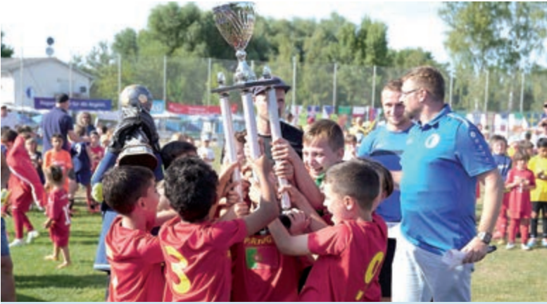
Mini-Weltmeister Portugal (SG Rosenhöhe) durfte sich über die Siegerpokale freuen.