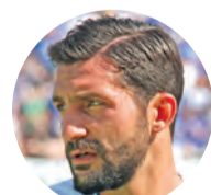
Aytaç Sulu Lilienlegende

Zu tippen sind Spiele der hessischen Kultmannschaften Darmstadt 98 und Eintracht Frankfurt! Es gibt attraktive Preise zu gewinnen. Der beste Tipper eines jeden Monats wird belohnt.