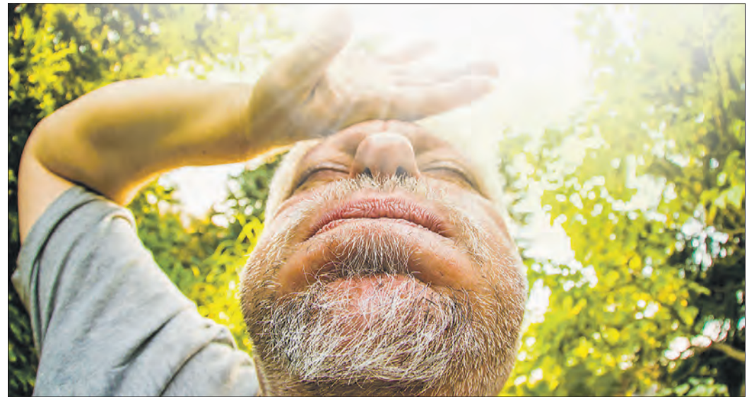
GERADE BEI ÄLTEREN MENSCHEN kann Hitze den Kreislauf belasten. Dann heißt es: schnell raus aus der Sonne und abkühlen.

Hitze und Extremwetter können krank machen - was wir tun können