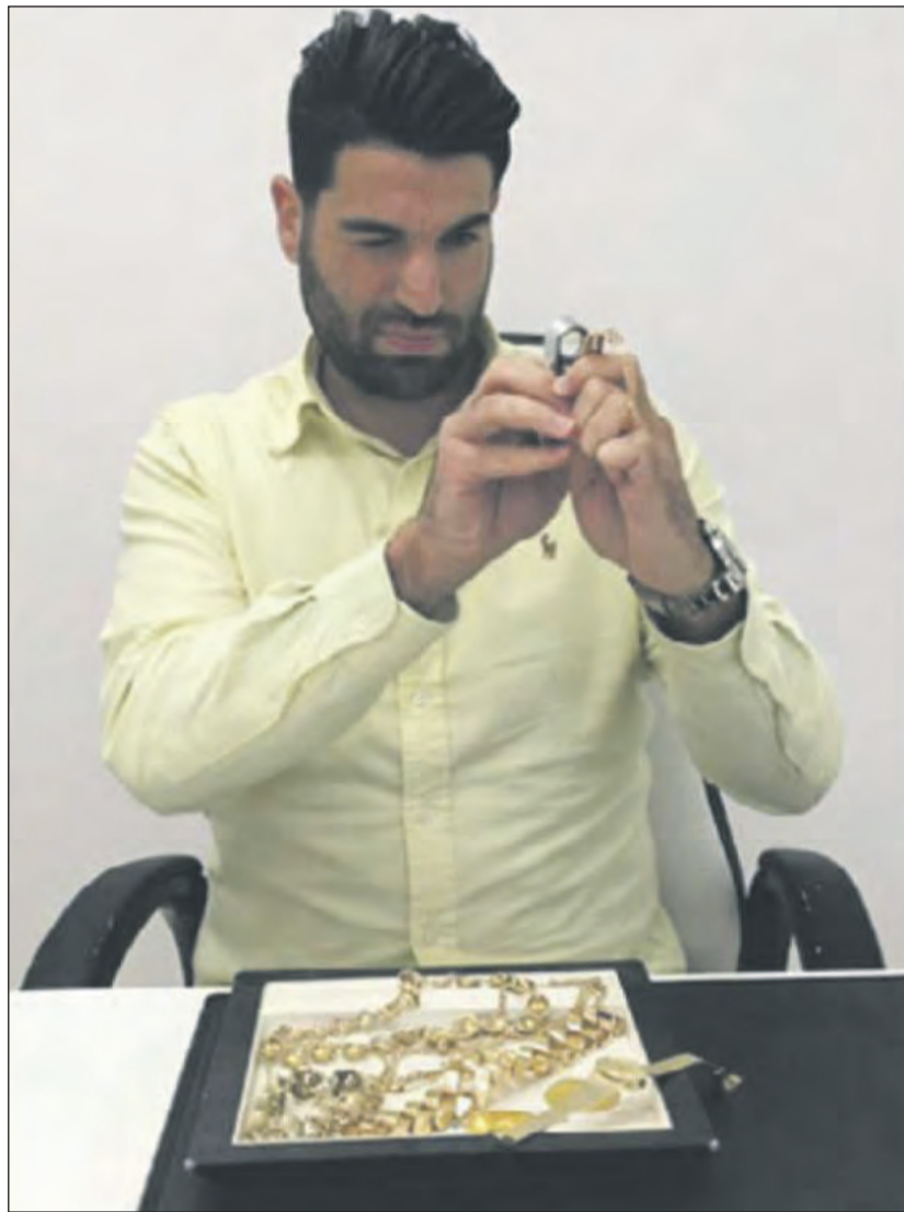
Ihr Spezialist für Goldankauf.