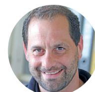
Peter Erbach Autohaus Iser Riedstadt