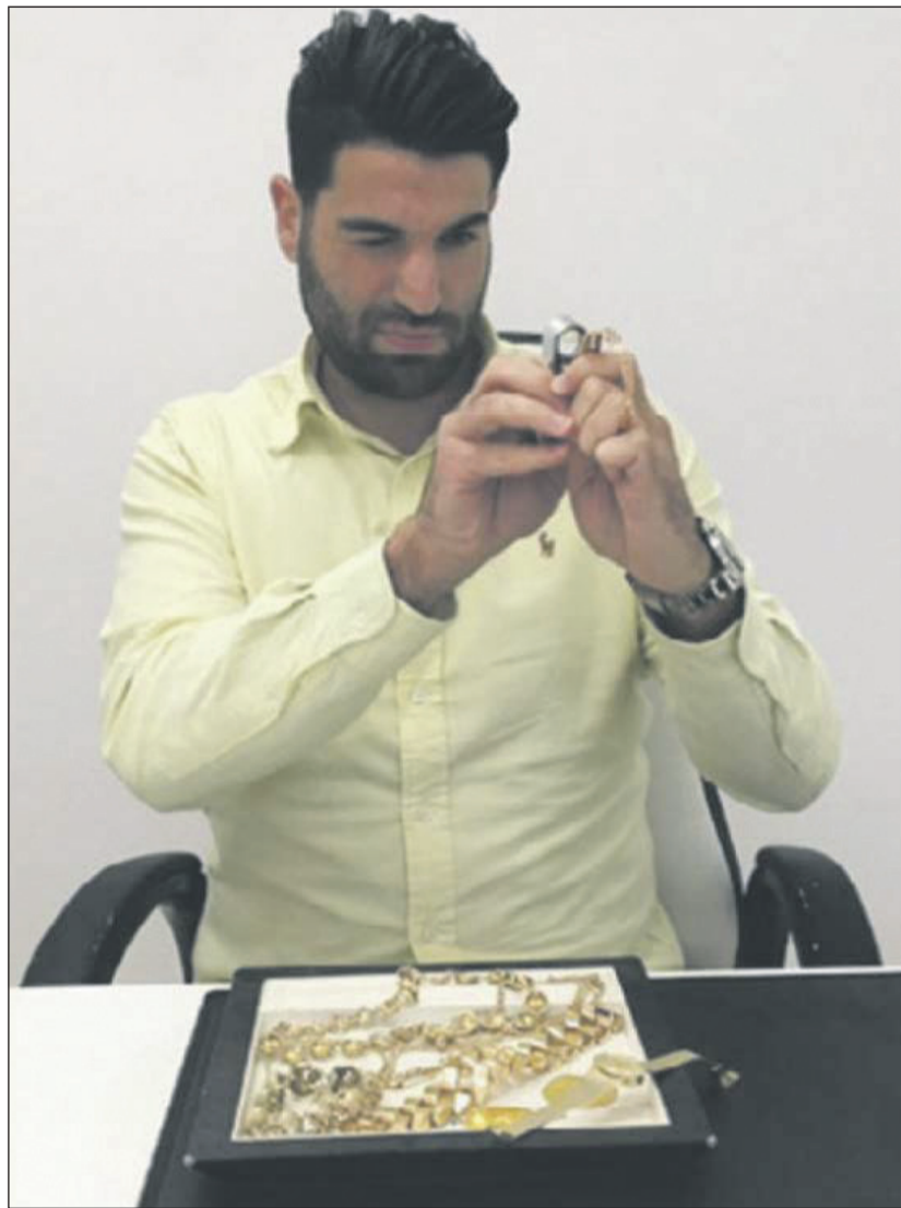
Ihr Spezialist für Goldankauf.