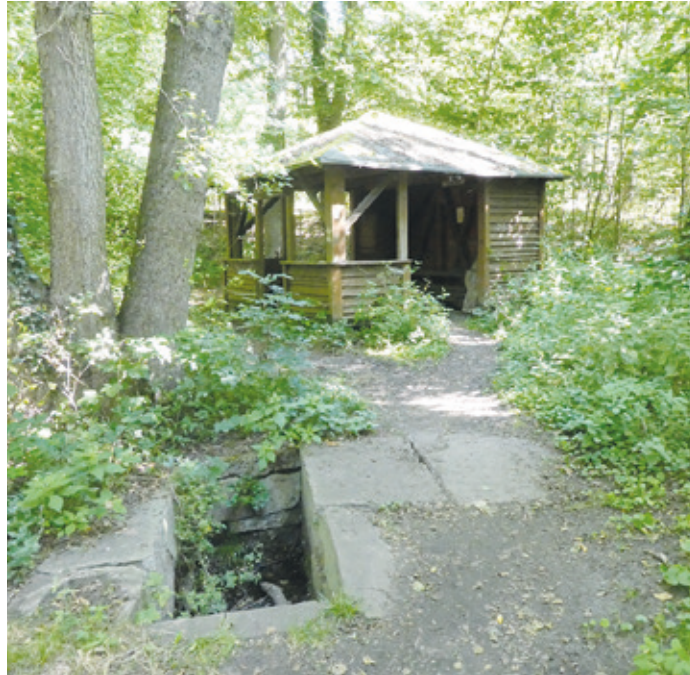
(Abb. 8) Das Ludwigsbrünnchen mit der Schutzhütte.

Das Brünnchen war einstmals ein beliebter Rastplatz in der Koberstadt. Es wartet aber zusammen mit einer Schutzhütte auf die Wiedererweckung aus einem Dornröschenschlaf, wie es in einem Zeitungsbericht hieß. 300 Jahre ist die erste Quelfassung wahrscheinlich alt. Damit wären wir wieder in der Zeit des jagdversessenen Landgrafen Ernst-Ludwig, der hier sein Pfläsur suchend um 1725 den Ort anlegte.