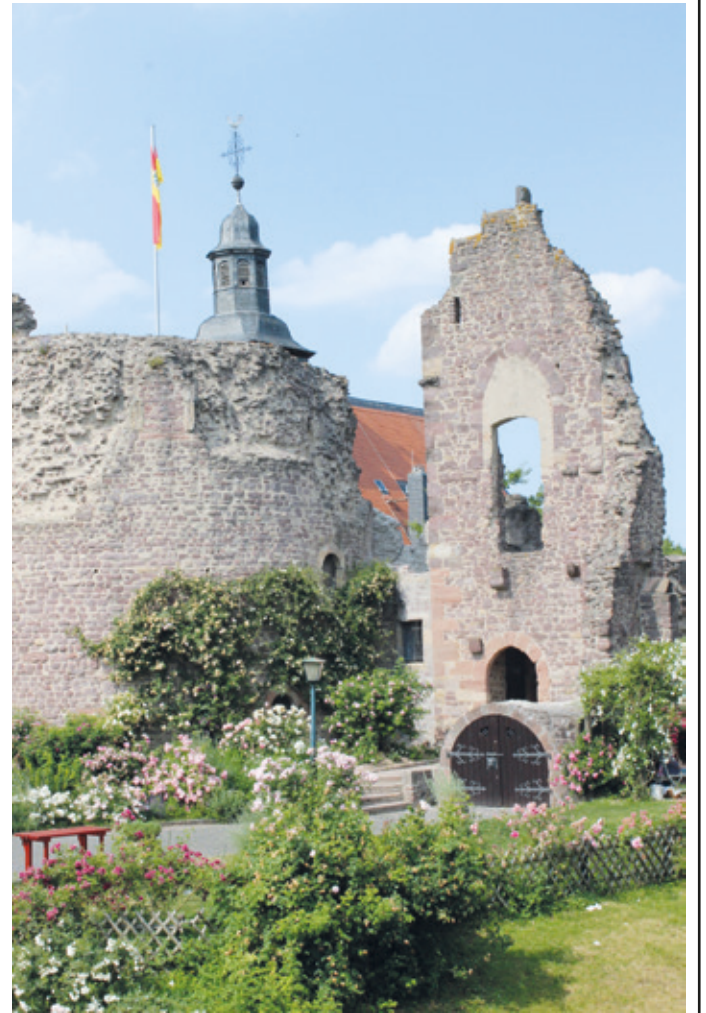
Die Burg mit Bergfried und Pallas

In seiner Bauidee zeigt der Palas Übereinstimmungen mit der Burg Münzenberg in der Wetterau, der zweiten namengebenden Buranlage der Hagen-Münzenberger. Heute sind noch romanische und gotische Bauelemente zu erkennen, die von den verschiedenen Umbauphasen zeugen. Der Eingang liegt neben dem Bergfried an der Westseite des Gebäudes. Links hinter einer Tür befinden sich die Reste eines steinernen Treppenturms, über den man das Obergeschoss erreichte. Von einem schmalen Gang aus gelangt man rechts in die ehemalige Küche mit dem gemauerten Herdsockel und einen angeschlossenen Vorratsraum. Dahinter bildet ein großer Versammlungs- oder Speisesaal das Zentrum des Palas', in dem sich noch der Kamin und Säulenbasen erkennen lassen.