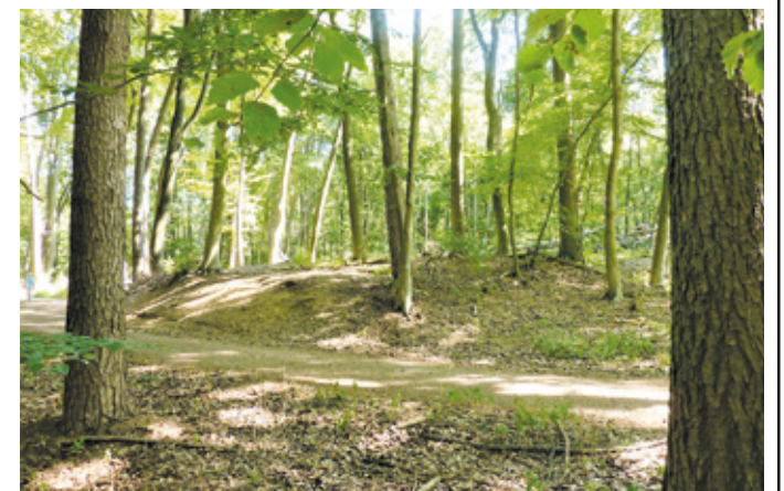
(Abb. 6) Eines der 29 Hügelgräber aus der älteren Eisenzeit.