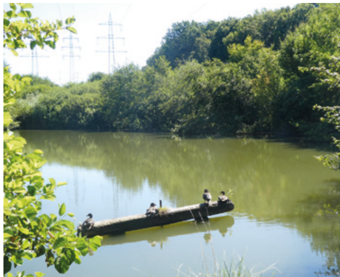
(Abb. 9) Am mittleren Egelswoog.

Rechts am oberen Woog entlang führt ein schmaler Pfad zu einer Asphaltstraße, welche die Autobahn unterquert. Dann links abbiegend kommen Sie zu dem mittleren der Egelswooge. Schleien, Hechte und Karpfen kommen hier vor. „Optisch beeinträchtigt wird die im Wald gelegene Teichlandschaft durch eine Trasse von Hochspannungsleitungen“ vermerkt eine Infotafel am Teich. Wer hat wohl die drei Teiche angelegt? Natürlich wieder Landgraf Ernst-Ludwig, der damals vielleicht seine Jagdgesellschaften mit frischem Fisch am beschriebenen Brünnchen verköstigen wollte.