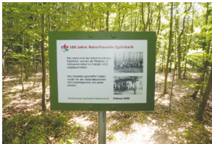
(Abb. 3) Hinweis bei der Steinkaute auf das 1933 beschlagnahmte und später zerstörte Naturfreundehaus.