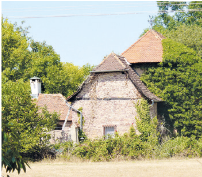
(Abb. 7a) Ehemaliges Koberstädter Forsthaus an der Bogenschneise.

Folgen Sie nun der Höllschneise und dem grünen Bakenkreuz. Ein Pfad führt Sie rechts zum Ludwigsbrünnchen und dem oberen Egelswoog, einem Teich. Der Teich wird vom Tränkbach gespeist, er ist also kein „Himmelswasser“.