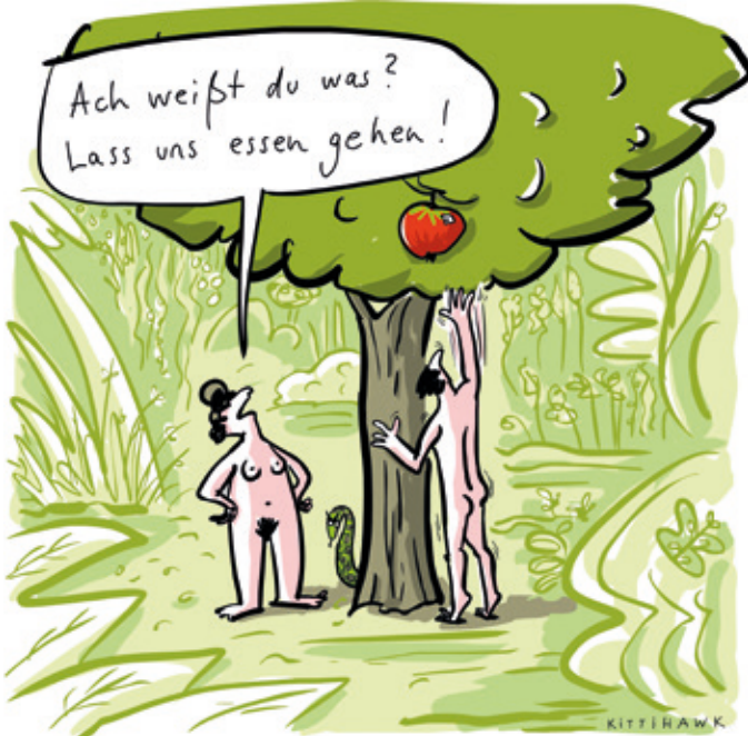
Cartoon aus der Sonderausstellung