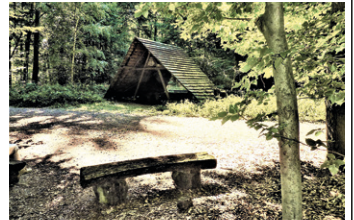
(Abb. 5) Die Koberstädter Schutzhütte am Dammweg.

Die Koberstädter Schutzhütte an der Kreuzung Lindenschneise/Dammweg wurde 1968 auf Initiative des Verkehrs- und Verschönerungsvereins Langen geplant und 1970 der Öffentlichkeit übergeben. Sie ist eine Nurdachhütte. Von hier kommen Sie auf mehreren Wegen und Umwegen zum Naturfreundehaus auf dem Oberen Steinberg in Langen. Wir empfehlen zunächst einen Abstecher zu den nahen Hügelgräbern.