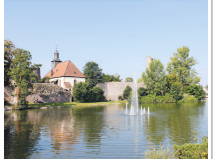
Ansicht der Burg mit der evangelischen Kirche auf dem Burggelände und dem Weiher davor