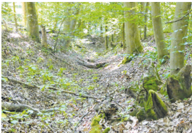
(Abb. 1) Der Graben der Landwehr am oberen Stellweg.

Die Tour beginnt am Bahnhof Erzhausen. Folgen Sie dem Waldweg zur B3 und biegen Sie an der letzten Querschneise schräg links in den schmalen Weg ein. Beim Forsthaus Bayerseich überqueren Sie die B3. Östlich der B3 verläuft parallel zum Heegbach der geschwungene Stellweg. Dieser wird links von einem Graben begleitet. Vor etwa 500 Jahren von Untertanen der hessischen Landgrafen gegraben, war er Teil eines Wall- und Grabensystems, das zusätzlich mit einem dichten Gebüsch aus undurchdringlichen Hecken bestückt war. Diese Landwehr trennte die Territorien der Landgrafen von Hessen südlich des Heegbachs von denen der Grafen von Ysenburg und Hanau nördlich davon. Es sollte Wild und Walddieben den Übergang verwehren. Sie stoßen auf einen vielbefahrenen Radfernweg, die Dreischlägerallee, wenden sich nach Norden, queren den Heegbach und biegen dann in die Offenthaler Schneise ein, der sie bis zur Höllschneise folgen. Gleich am Anfang der Offenthaler Schneise gibt es einige Hügelgräber der Eisen- oder Hallstattzeit aus dem 8. und 7. Jhd. v. Chr. Näher an die Grabhügel und an die unter Naturschutz stehende Bachaue kommen Sie auf dem Weg, der kurz hinter dem Bach rechts in den Wald führt. Er ist nicht für Radfahrer geeignet. Eine Zwischenrast können Sie an dem romantisch im Wald gelegenen Ernst-Ludwig Teich einlegen, über den wir in der Kolumne 2/6 berichtet haben. Über die Höllschneise gelangen Sie zum Weißen Tempel.