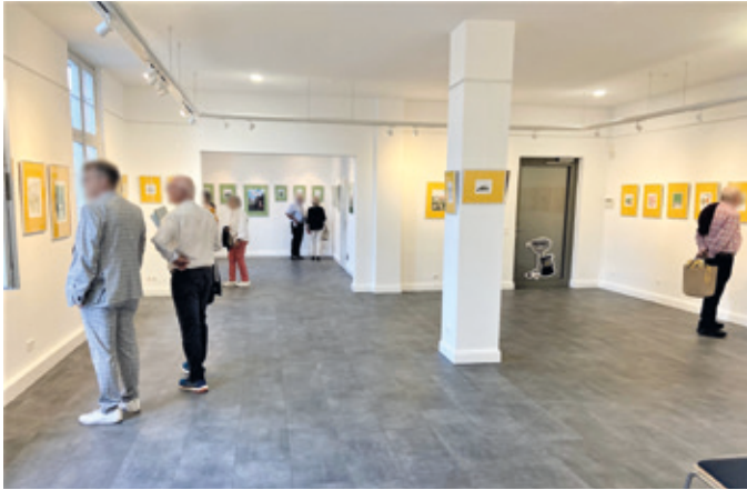
Raum der Sonderausstellung