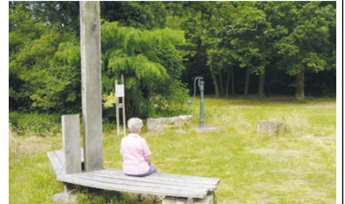
(Abb. 4) Was vom ehemaligen Koberstädter Falltorhaus blieb.