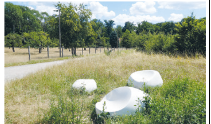
(Abb. 10b) Sitzkiesel beim ehemaligen Forsthaus.