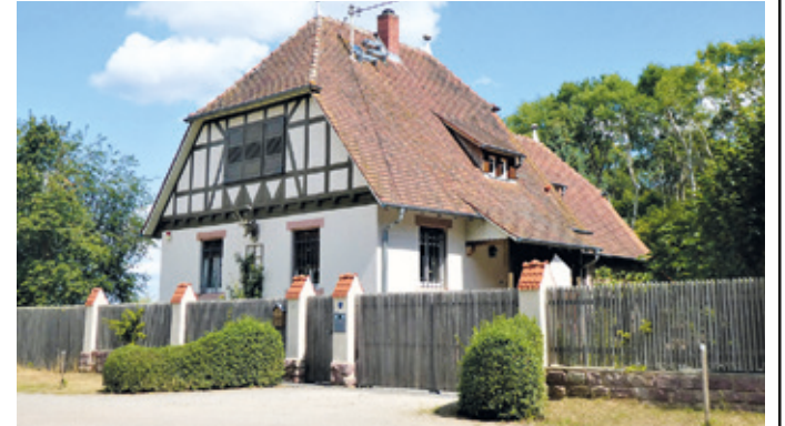
(Abb. 10a) Das ehemalige Forsthaus Krause Buche.

Folgen Sie nun dem bequem ausgebauten abschüssigen Weg entlang der Wald-Feld-Grenze bis zum Forsthaus Krause Buche. Unterwegs haben Sie „am großen Bogen“ schöne Ausblicke, die bis zum Taunus reichen. (Dort in eine Schneise links und dann in den Pfad der Steinkautschneise links einbiegend kommen Sie auch zur oben beschriebenen Steinkaute). Das Forsthaus Krause Buche, heute privat genutzt, ist ein markantes Beispiel für den Landhausstil der vorletzten Jahrhundertwende mit Sichtfachwerk und einem Natursteinfundament. Dieses und die anderen Forsthäuser in der Koberstadt stehen auch für die Bedeutung der effektiven Beförderung und den Schutz des großen Schatzes der Region – dem Wald. Vor dem Forsthaus Krause Buche biegen Sie rechts ab zur Bayerseich und weiter geradeaus zum Radschnellweg nach Erzhausen. Am Anfang stehen einige einladende weiße Sitzkiesel. Unterwegs kommen Sie an dem Aussiedlerhof Birkenhof mit seinem Hofladen vorbei.