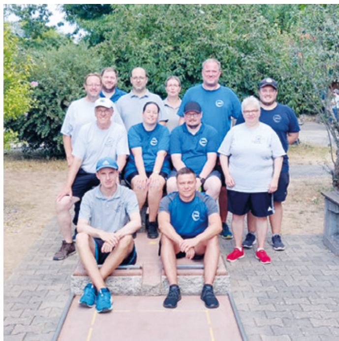
Teams der SGA (blau) und des MC Weinheim (grau) beim Achtelfinale des DMV-Pokals.

(EH) Am Sonntag, den 21. August, fand auf der Minigolfanlage des 1. MC Weinheim das Achtelfinale des DMV-Pokals statt. Bei bestem Minigolfwetter spielten die Arheilger über drei Runden auf der als eher einfach einzustufenden Betonanlage konstant sehr gute Ergebnisse, während das Team aus Weinheim unter seinen Möglichkeiten blieb. Beim Wettbewerb um den DMV-Pokal wird nicht die Schlagzahl der Mannschaft addiert und gegeneinander gewertet, sondern es spielt jede/r Spieler/in gegen den/ die auf gleicher Platznummer gesetzten Spieler/in der gegnerischen Mannschaft. Der/die schlagbeste/r Spieler/ in jeder Spielrunde erhält 2 Punkte, bei Unentschieden jeder 1 Punkt. Ein System, das auch eine taktisch geschickte Mannschaftsaufstellung erfordert. Der Gastverein kann seine Mannschaftsaufstellung gegen den Heimverein setzen. Eine geschickte Mannschaftsaufstellung kann da mitunter