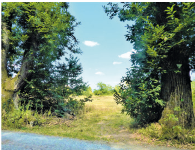
(Abb. 7b) Allee der Esskastanien an der Bogenschneise.