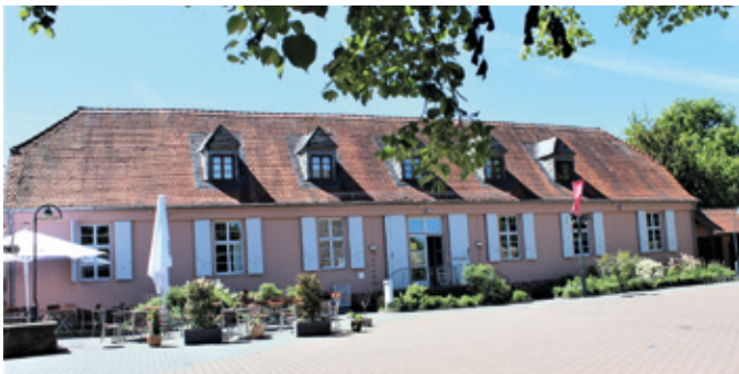
Das Museum auf dem Burghof

Das Museum gewann 2018 den Museumspreis der Sparkassen-Kulturstiftung Hessen-Thüringen und wurde im Juli 2022 vom Hessischen Ministerium für Wissenschaft und Kunst mit dem Preis „Museum des Monats“ ausgezeichnet.