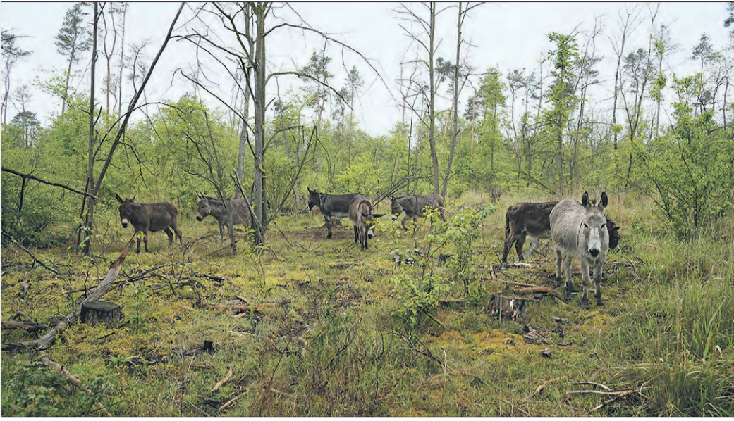
SIE SIND WIEDER DA, Esel weiden Am Krohberg.

Stadt Griesheim plant Müllsammelaktion auf erster Beweidungsfläche