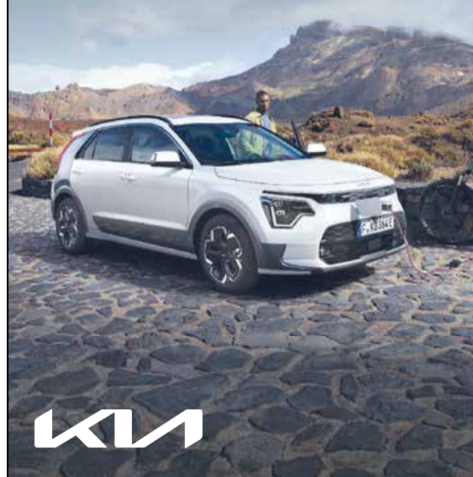
Abbildung zeigt kostenpflichtige Sonderausstattung.

Mit dem neuen Kia Niro kannst du einfach größer denken - in jeder Hinsicht. Du brauchst mehr Raum für deine Ideen? Der Kia Niro gibt ihn dir. Du möchtest elektrisch unterwegs sein? Der Kia Niro bietet dir gleich drei alternative Antriebsformen. Du wünschst dir unkomplizierte Stromanschlussmöglichkeiten auf deinen Reisen? Hast du, denn mit der Vehicle-to-Device-Funktion beim Kia Niro EV lassen sich Elektrogeräte wie dein E-Bike direkt am Fahrzeug aufladen. Überzeuge dich selbst bei einer Probefahrt.