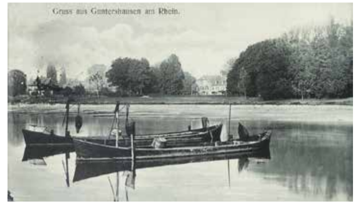
Altrhein und Hofgut Guntershausen um 1910.

Stockstadt – Zur Führung „Auf historischen Spuren – vom Altrhein zum Hofgut Guntershausen“ lädt das Museum Stockstadt am Rhein am Sonntag, dem 4. September 2022 ein.