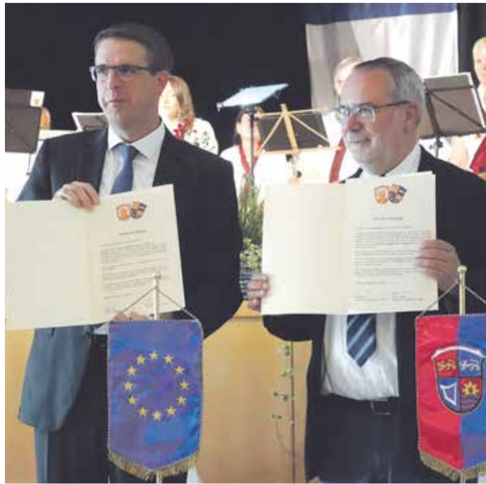
Die Verschwisterungsurkunden sind unterzeichnet.