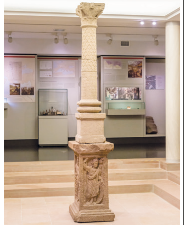
Die berühmte römische Jupitersäule.