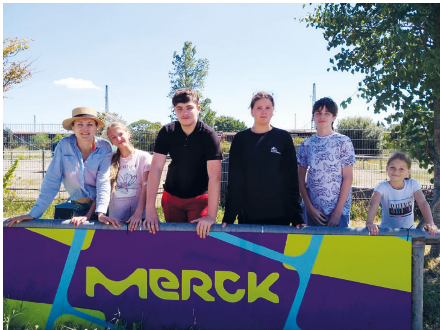
Dank der Unterstützung der Firma Merck konnten in diesem Jahr auch Kinder und Jugendliche aus der Ukraine an einer Ferienfreizeit des Reitvereins Arheilgen teilnehmen.

150 Kinder erlebten Reiterferien – Kooperation mit der Firma Merck