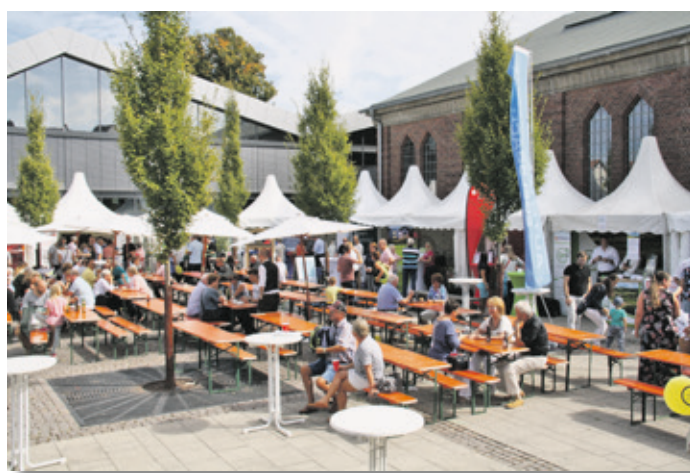
Impressionen von der letzten Gewerbeschau 2018.