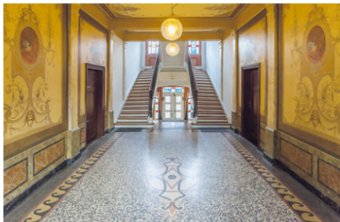
Das Foyer des Schlosses. Nicht nur die Exponate, die von den Römern bis in die Nachkriegszeit reichen, sind sehenswert, auch das Schloss selbst ist sehenswert weil es das Repräsentationsbedürfnis einer Familie des niederen Adels widerspiegelt.

Auch Dieburgs ältester Kolonialwarenladen „Lisa Lang“ findet sich mit altbekannten Produkten, Firmenschildern, Verpackungen und so manchen Kuriositäten in der Ausstellung, ebenso wie eine Blaufärberwerkstatt aus Fränkisch-Crumbach, die vollständig vom Museum übernommen wurde.