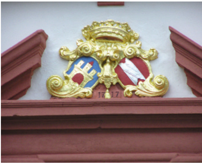
Das Wappen der Ulner über dem Schlossportal mit der dreitürmigen Burg.