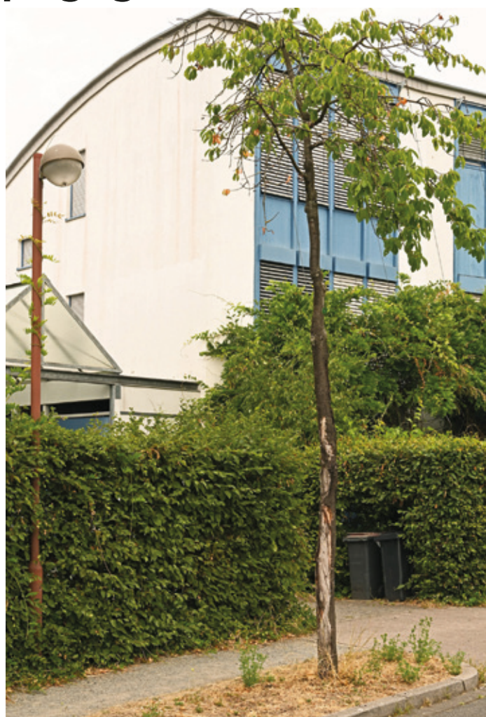
Ein Darmstädter Stadtbaum in der Dürre vor seinem Ende: Schütterer Krone, abgeplatzte Rinde, keine Bewässerung.