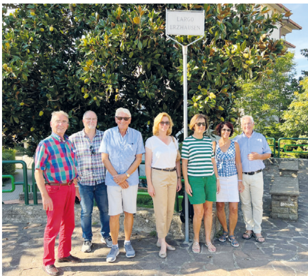
Delegation in Italien.

Liebe Erzhäuserinnen, liebe Erzhäuser, am Di., 27.09.2022, um 19 Uhr, findet im Bürgerhaus eine Informationsveranstaltung zur Überplanung des Friedhofs statt. Der Friedhof soll attraktiver werden. Es sollen andere Nutzungsformen mit aufgenommen und der karge ungenutzte Teil umgestaltet, bepflanzt und schön angelegt werden. Diese Maßnahme ist kein Leitbildthema, sondern geht auf einen älteren Antrag der SPD zurück. Die Vorstellung von einem Friedhof als Ruhestätte und Ort zum Verweilen und Gedenken, an dem man gerne ist, war mir aber von Anfang an ein wichtiges Anliegen. Darum freue ich mich, dass das Büro Götte Landschaftsarchitekten GmbH der Öffentlichkeit vorstellen wird, was in mehreren Sitzungen gemeinsam mit dem Gemeindevorstand entstanden ist und bereits mit sehr positiver Resonanz im Bau-, Verkehrs- und Umweltausschuss präsentiert wurde. Ziel der Veranstaltung ist es, die Anregungen und Wünsche der Erzhäuserinnen und Erzhäuser zu hören und bei einer konkreten Planung und Ausführung zu berücksichtigen. Wir freuen uns auf eine rege Beteiligung.