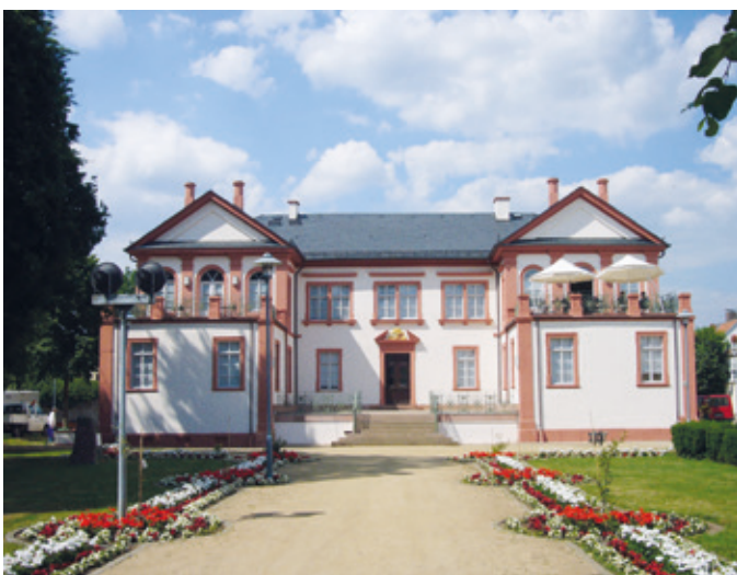
Das Fechenbach'sche Schloss.