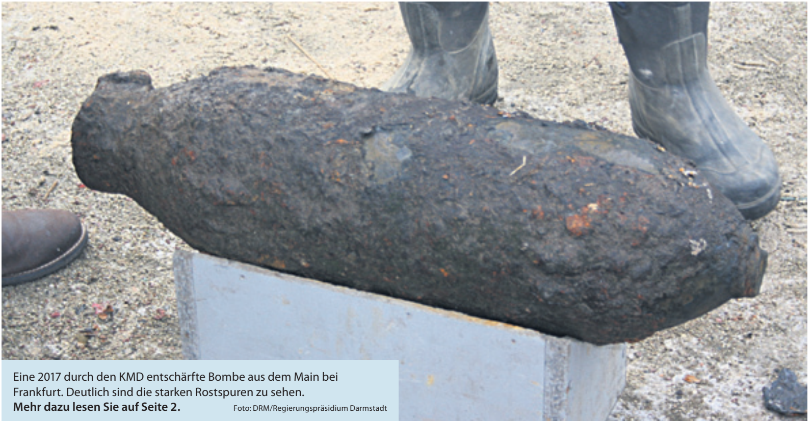
Eine 2017 durch den KMD entschärfte Bombe aus dem Main bei Frankfurt. Deutlich sind die starken Rostspuren zu sehen. Mehr dazu lesen Sie auf Seite 2.