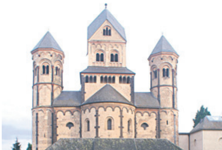
Die beeindruckende Basilika der Abtei Maria Laach mit der Klosterkirche wurde zu einer Basilika Minor erklärt.

Mehr Informationen rund um den Laacher See gibt es im Internet unter www.vulkanregion-laachersee.de . Telefonisch erreicht man die Ferienregion Laacher See unter 02636-19433.