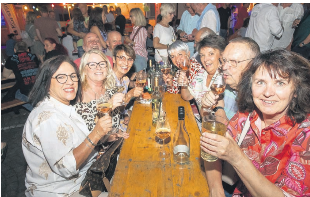
Deutlich über 1.000 Gäste nahmen an der Premiere des Weinfestes teil.

Dass auf dem gepflasterten Karree zwischen Verwaltungszentrale und Trinkbrunnenstraße ein Schöppchen unter freiem Himmel gut schmeckt: Das zeigt sich allwöchentlich beim Ausschank während des Rodaumarcktes. Jetzt hat das Fest den endgültigen Beweis geliefert: „Was den Orwischern die Woigass, ist den Oweräirern der Woiplatz!“