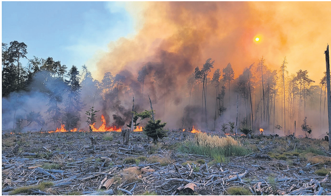
Brennender Wald bei Münster.

Münster (MA) Die Feuerwehr Münster möchte sich an dieser Stelle nochmals recht herzlich bei allen Helfern und Unterstützern bedanken, sowohl von anderen Feuerwehren und Hilfsorganisationen als auch der Bevölkerung. Recht herzlich den Dank für die vielen Getränke- und Essensspenden. Wer die Feuerwehr jetzt noch unterstützen möchte, kann dies am besten mit einer passiven oder auch aktiven Mitgliedschaft machen. Willkommen sind aber auch Geldspenden an den Förderverein. Das Beitrittsformular und Infos wie man spenden kann, findet man auf der Homepage unter www.feuerwehr-muenster.com . Alle, die Interesse bekommen haben aktiv unterstützen zu wollen, können am besten mal bei den Unterrichtsvorbeischaun oder Meldung unter info@feuerwehr-muenster.com .