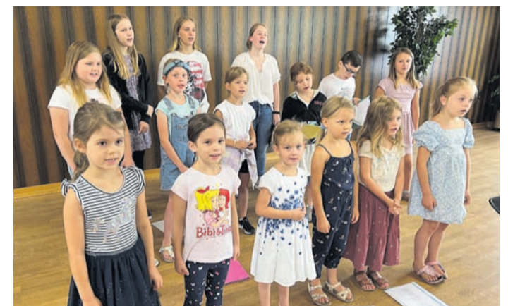
Erste Kostproben und erste Lieder aus dem Kindermusical „Aladin und die Wunderlampe“ gaben die Kinder vom Regenbogenchor bereits zur Eröffnung des Singendes Weindorfs beim MGV-Weinfest zum Besten und wurden dafür mit reichlich Applaus belohnt.