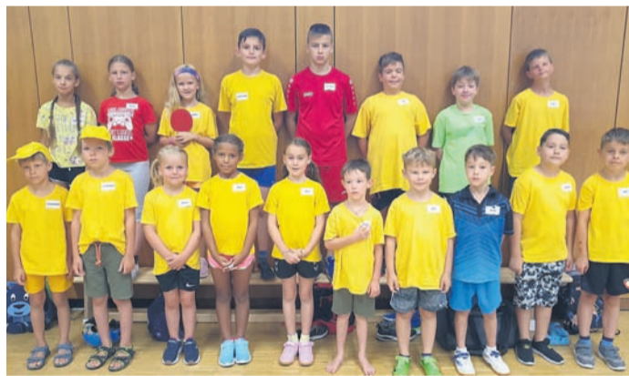
Insgesamt 18 Kinder nahmen an den Ferienspielen des TTC Ep- pertshausen teil.

Eppertshausen (EA) Der TTC Eppertshausen betreute im Rah- men der Ferienspiele insgesamt 18 Kinder einen Tag in der Bür- gerhalle.