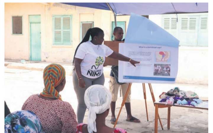
Aminu Initiative in Kooperation mit der ghanaischen Partnerorganisation Cin Gaban Nima - Menstruationstassenprojekt im Rahmen der Mädchen- und Frauenförderung in Nima-Accra, Ghana.

Auch wenn gerade Renovierungs- und Umbaumaßnahmen am Hauptgebäude durchgeführt werden, sind einige Programme bereits angelaufen. Einer der Schwerpunkte ist die Förderung von Mädchen und Frauen. Und so freut man sich, dass die ghanaischen Kolleginnen gemeinsam mit den weltweit Freiwilligen und einer deutschen Praktikantin, die aktuell im Einsatz in Ghana ist, ein Menstruationstassen-Projekt auf die Beine gestellt haben. Menstruationstassen sind eine nachhaltige und umweltfreundliche Alternative zu herkömmlichen Menstruationshy-