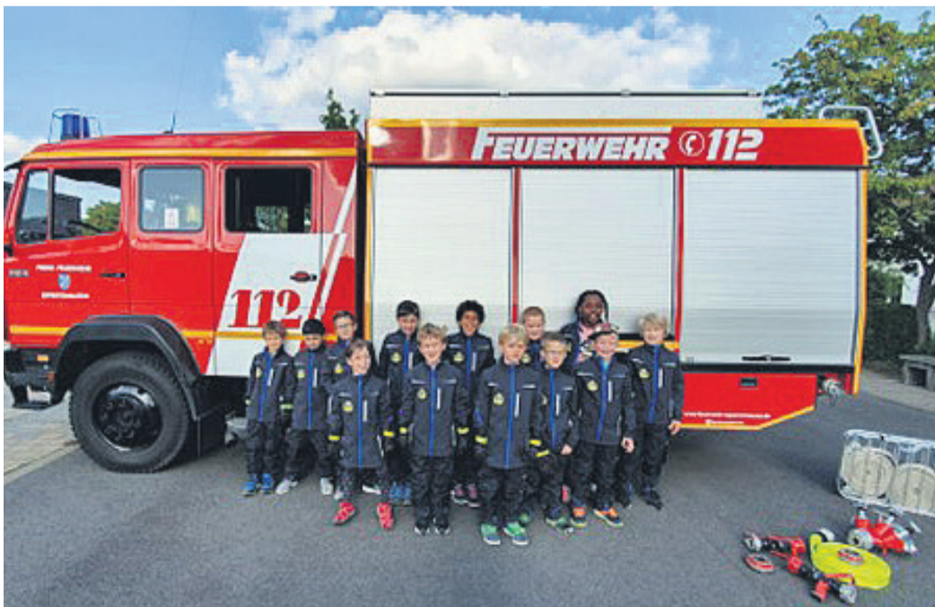
Gruppenfoto der Löschwölfe im Herbst 2019.

willigen Feuerwehr Eppertshausen, Achim Joha (achim.joha@feuerwehr-eppertshausen.de) über die Betreuertätigkeit informieren und anmelden.