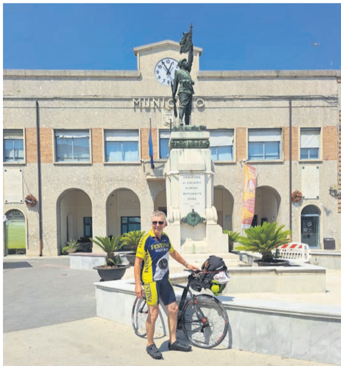
Vor dem Rathaus der Partnergemeinde Codigoro.

auch mit Abstand die schlechteste Pizza (29 Franken) und dazu schales Bier. Tag vier sollte der härteste werden. Sehr früh, auf der Via Mala immer in Sichtweite des jungen Rheins, der ständig seine Farben wechselte, ging es nach Splügen. Verpflegungsstopp, dann hinauf zur Königsetappe. In unzähligen Serpentin im kleinsten Gang, über 2 Stunden hinauf auf über 2100 Meter. Auf der Passhöhe entschädigte ein grandioser Blick auf die Bergwelt der Dreitausender. Danach rollte das Rad fast 30 Kilometer ohne zu treten. An der Nordspitze des Comersees ging es in das Valtellina-Tal, das am Tagesende nochmals mit einer grandiosen Steigung aufwartete. In Aprica, nach fast 190 Kilometer gab's das hart verdiente Weizen und ein tolles Abendessen. Von nun an ging's bergab. Sehr zeitig klickten die Rennschuhe in die Pedalen. Brescia, am Südufer des Gardasees entlang, ging die Fahrt am fünften Tag nach Verona. Trotz Recherche und intensiver Suche gab es keine Übernachtungsmöglichkeiten, selbst jenseits der 200 Euro-Marke. Alles restlos ausgebucht wegen der Festspielzeit. Ein Hotelier vermittelte bei einem Freund im 50 km entfernten Legnago ein günstiges Zimmer mit dem Zusatztipp die Bahn zu nehmen. Dieser Tipp war goldrichtig. Ausgeruht und ohne die befürchteten Schmerzen durch den har-