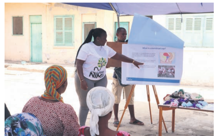
Aminu Initiative in Kooperation mit der ghanaischen Partnerorganisation Cin Gaban Nima - Menstruationstassenprojekt im Rahmen der Mädchen- und Frauenförderung in Nima-Accra, Ghana.

Auch wenn gerade Renovierungs- und Umbaumaßnahmen am Hauptgebäude durchgeführt werden, sind einige Programme bereits angelaufen. Einer der Schwerpunkte ist die Förderung von Mädchen und Frauen. Und so freut man sich, dass die ghanaischen Kolleginnen gemeinsam mit den weltweit Freiwilligen und einer deutschen Praktikantin, die aktuell im Einsatz in Ghana ist, ein Menstruationstassen-Projekt auf die Beine gestellt haben. Menstruationstassen sind eine nachhaltige und umweltfreundliche Alternative zu herkömmlichen Menstruationshy-