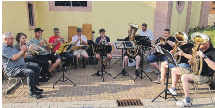
„Die kleinen Egerländer“ des Musikvereins Dudenhofen.