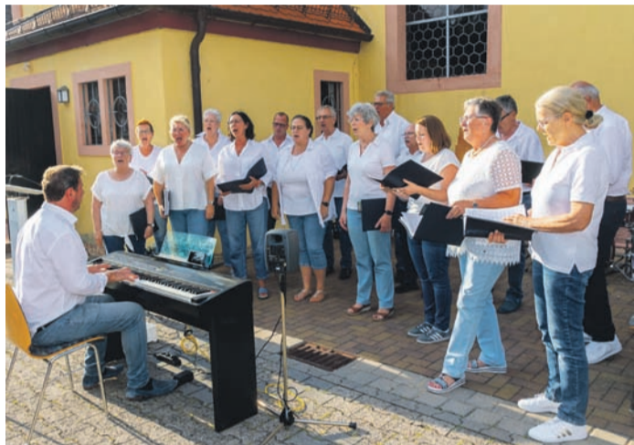
Überzeugten auch in diesem Jahr: Mixed Generations vom Gesangverein Germania.