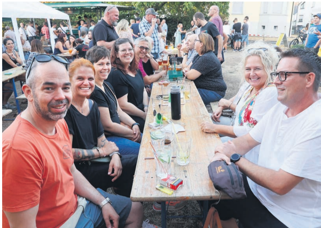
Vollbesetzte Bänke im Pfarrgarten.