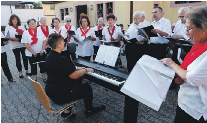
Starker Auftritt: Gesangverein „Volkschor“ Dudenhofen.