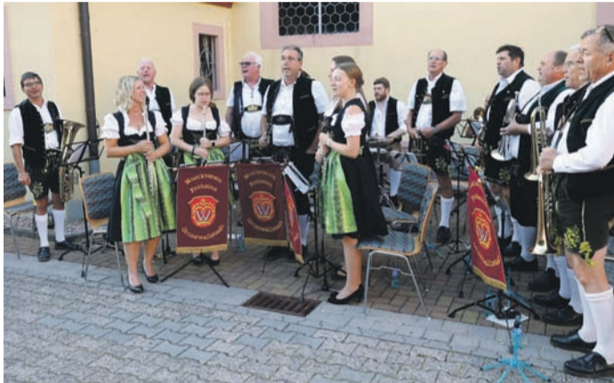
Begeisterten mit ihren Gesangs- und Musikbeiträgen: Musikverein Grosswallstadt.