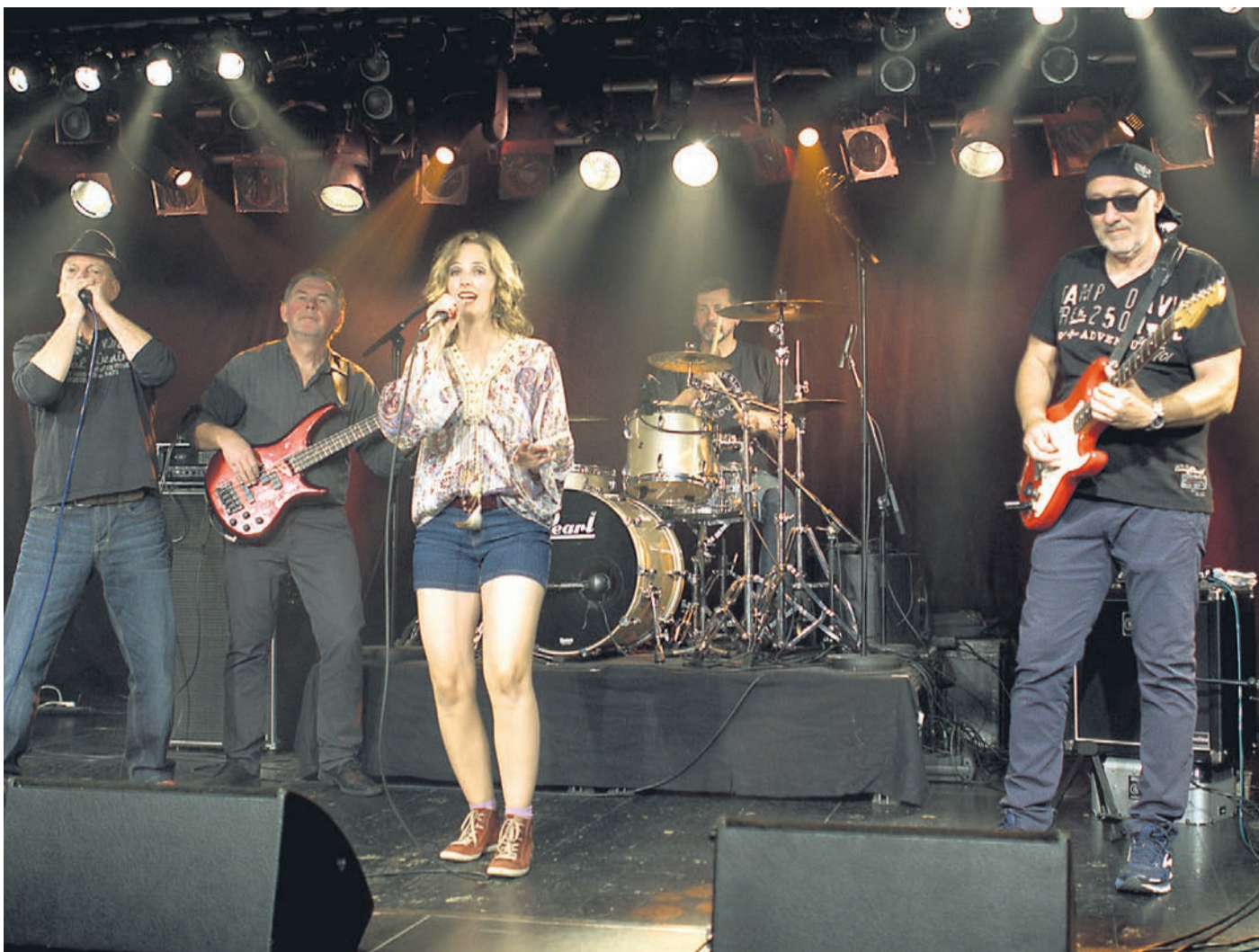
Die Foolhouse Blues Band ist am 27. August zu Gast.