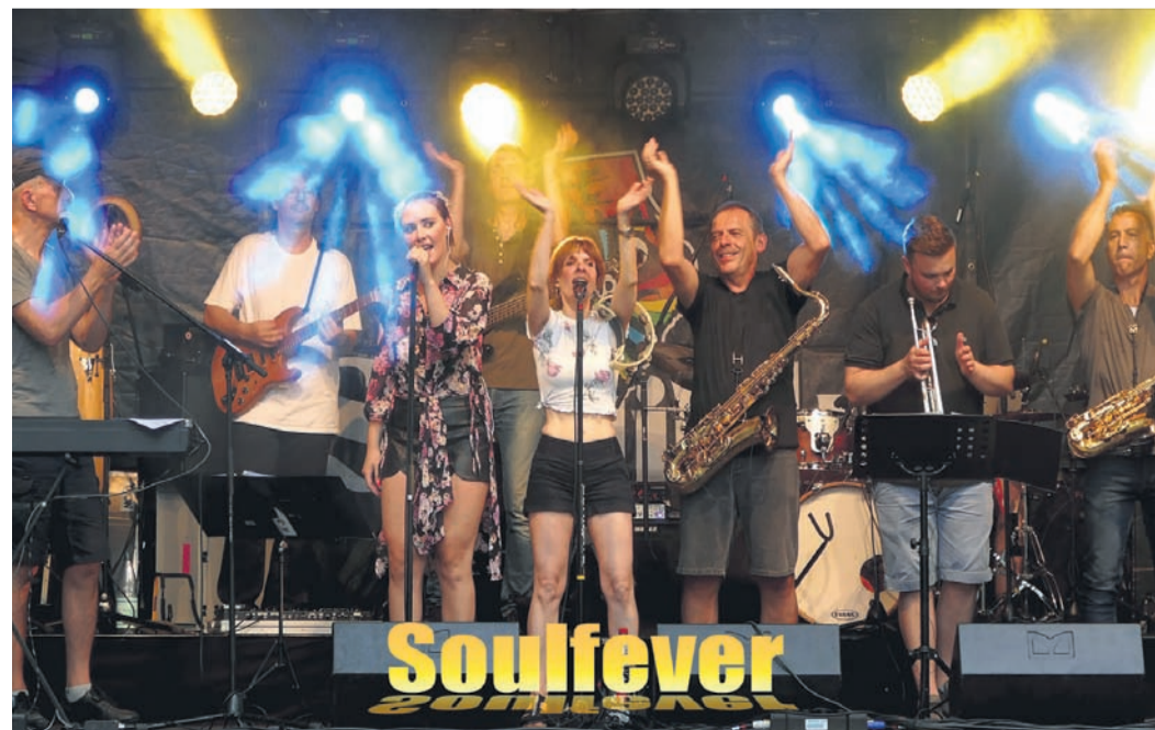
Die Band Soulfever ist beim 24-Stunden-Lauf ebenfalls dabei.

Den Bandreigen eröffnet um ca. 18.30 Uhr die Band „GRUPPE BLUMENSTRAUSS“ mit Mitgliedern aus Rodgau, Offenbach und Obertshausen. Die als inklusives Musikprojekt der Behindertenhilfe Offenbach gestartete Band macht seit drei Jahren gemeinsam Musik. Ihre mitreißenden Stücke erzählt aus Perspektive der Mitglieder von den schönen und weniger schönen Seiten des Alltags und den Träumen von einer besseren Zukunft. Mit finanzi-