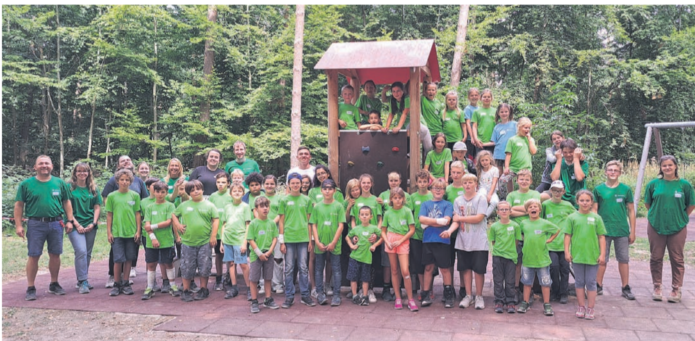
Auf Wiedersehen bis zum nächsten Jahr! Die Zukunftsretter und die Betreuer in der Waldfreizeitanlage Hainhausen.

Dazu kommt der Hochwasserschutz, den der Biber kostenlos für die Kommune betreibt. Er schafft Retentionsflächen und kontrolliert durch seine Dämme den schnellen Durchfluss des Gewässers. Retentionsflächen entstehen meist in den dafür vorgesehenen Überschwemmungsgebieten, die vorrangig dafür vorgesehen sind. Zu guter Letzt sei auch darauf hingewiesen, dass es Untersuchungen zur Filterwirkung von Biberdämmen gibt. Schwebstoff, Phosphate und Nitrate werden an dem Damm zurück gehalten und lagern sich davor ab. Die sich dort ansammelnden Pflanzen nutzen diese Stoffe und entziehen sie somit dem Gewässer.