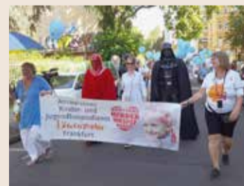
Kinder-Lebens-Lauf 2022 in Frankfurt.

hauptamtliche Helfer sowie medienwirksame Aktionen: Das sind die Zutaten für den sogenannten „Kinder-Lebens-Lauf“, den der Bundesverband Kinderhospiz veranstaltet. Hinter diesen nüchternen Fakten stehen Schicksale: Todkranke Kinder und deren Familien, die auf die Begleitung durch Hospizdienste hoffen. Dass es daran aber immer noch fehlt, darauf haben auch Betroffene beim Halt des vom 07. April bis zum 07. Oktober stattfindenden Kinder-Lebens-Lauf 2022 in Frankfurt aufmerksam gemacht. Rund vierhundert Kinder sind zurzeit in der Mainmetropole unheilbar erkrankt. Die meisten von ihnen werden nicht begleitet, weil Hospizdienste unterversorgt sind.