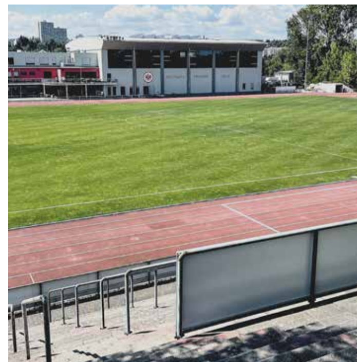
Das Sportleistungszentrum von Eintracht Frankfurt aus Sicht der Tribüne des Riederwaldstadions.