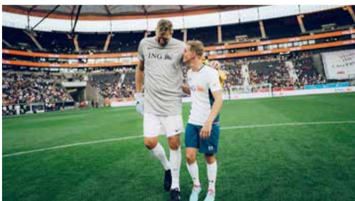
„Kleiner“ Größenunterschied: Die Mannschaftskapitäne Dirk Nowitzki (links) und Mick Schumacher hatten zum Promi-Kicken für den guten Zweck eingeladen.