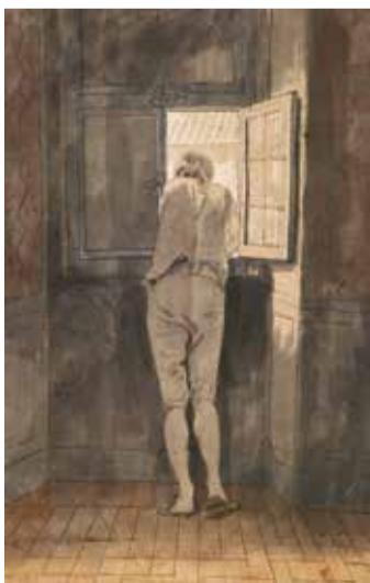
Johann Heinrich Wilhelm Tischbein: Goethe am Fenster seiner Wohnung am Corso in Rom, 1787

Zeichnungen und Aquarelle aus dem Freien Deutschen Hochstift