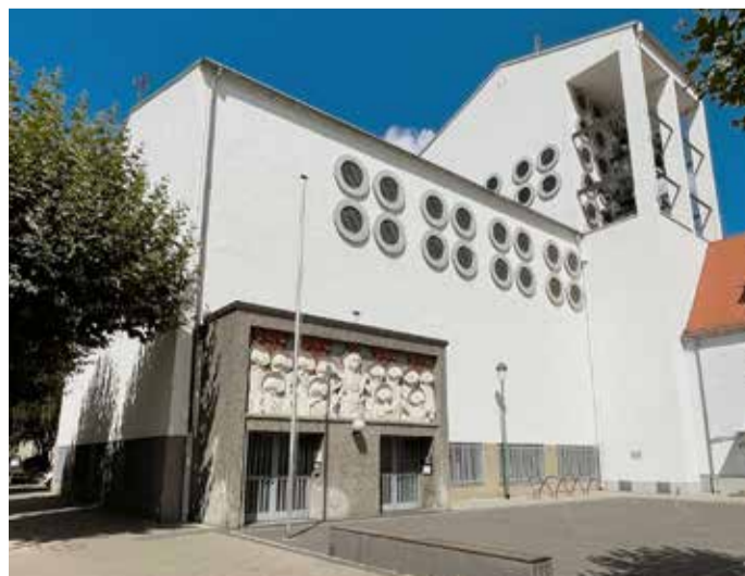
Die Heilig-Geist-Kirche in der Mitte der ehemaligen Arbeitersiedlung.